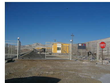
Нарангийн Энгэрийн Төвлөрсөн Хогийн Цэг

Мастер төлөвлөгөөг хэрэгжүүлж эхэлснээр хотын хатуу хог хаягдлын менежментийн тогтолцоонд дэвшил гарч байгаа боловч цаашид хийж сайжруулах зүйлс байсаар л байна. Тухайлбал хатуу