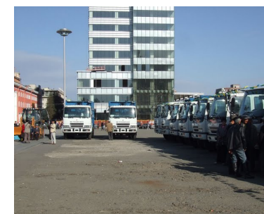
Хог тээврийн автомашин

Энэхүү төслийн хэрэгжүүлэхийн өмнө мастер төлөвлөгөөнд заасан зорилтуудын биелэлтийг тогтоож, төлөвлөсөн түвшинд хүрээгүй шалтгааныг нарийн тодруулах шаардлагатай байгаа юм.