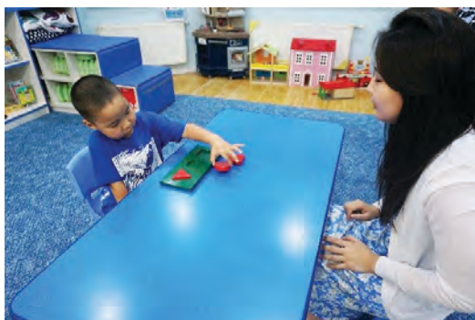
Хэвнээс дугуй дүрсийг гаргах