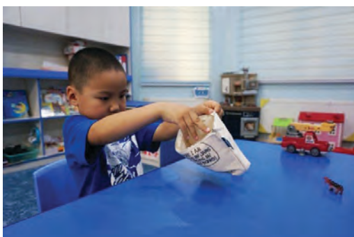
Уутанд эд юмсыг буцаан хийж, цахилгааныг татах