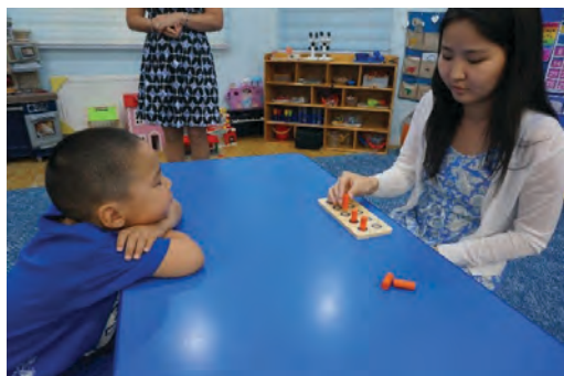
“Пэг” тоглоомын сууринд дүрсийг хийж үзүүлэх