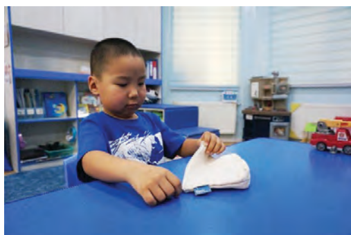
Уутны цахилгааныг нээж, доторх эд юмсыг гаргах