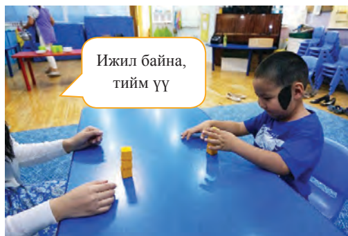
Хүүхэд багшийг дуурайж өрөх