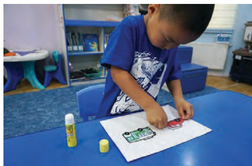
Цавуудсан дүрсээ хүрээнд наах