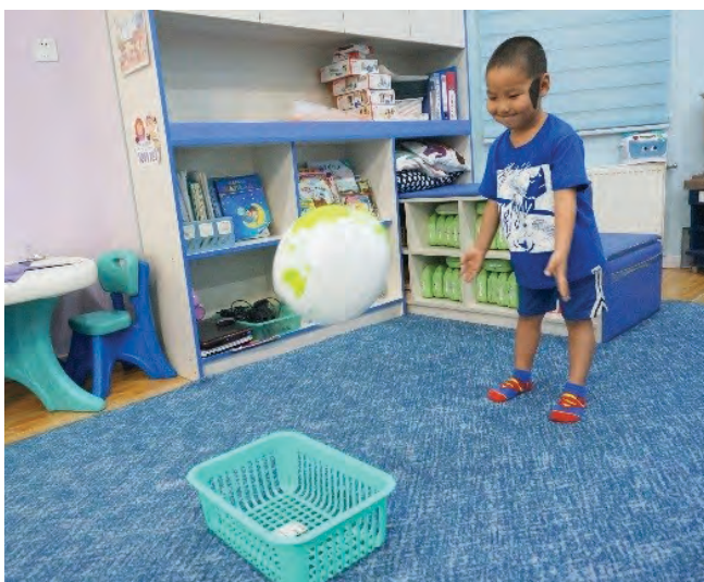
Бөмбөгөө шидэж оруулах