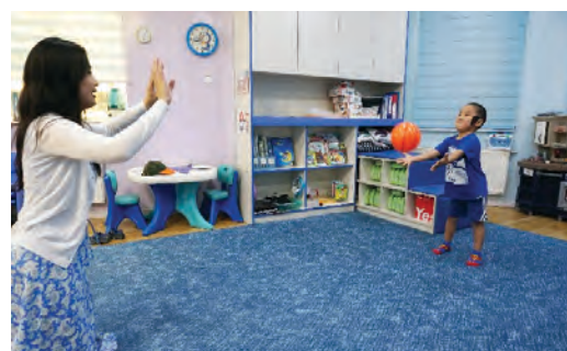
Хүүхэд бөмбөгийг барьж авах