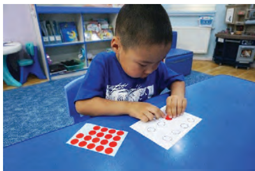
Том наалтыг хүрээн дотор наах