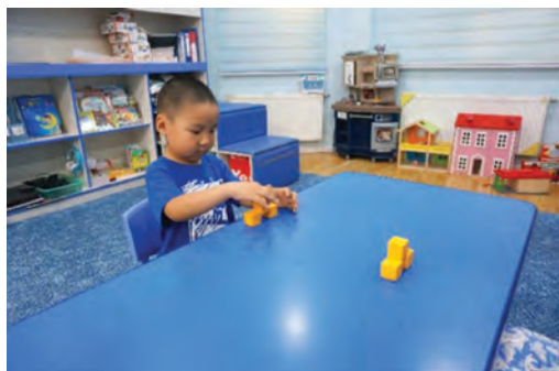
Багшийг дуурайж хүүхэд шоог өрөх