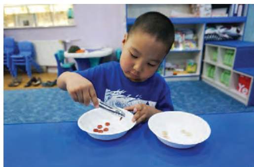
Хавчаараар хавчин эд зүйлсийг нэг тавагнаас нөгөө таваг уруу хийх