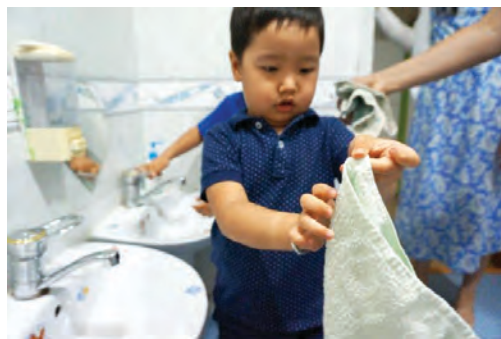
Алчуур өгөхөд гараа арчих