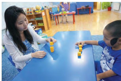
Багш шоо өрж байгааг хүүхэд ажиглах