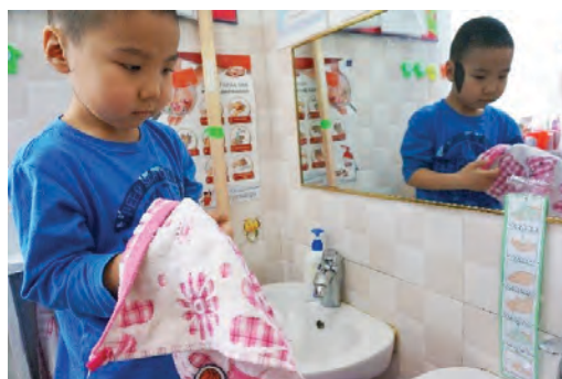
Өөрөө гараа арчих