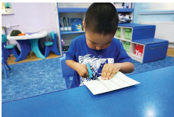
Цаасыг зураасны дагуу хайчлах