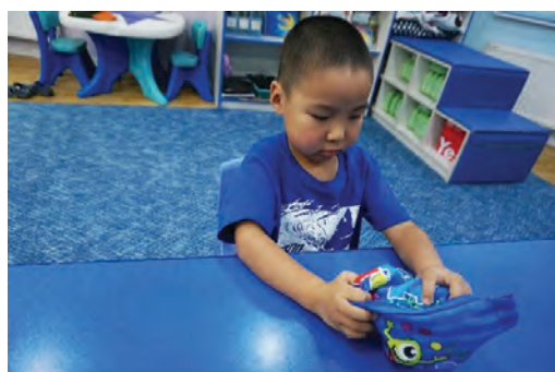
Уутанд юу байгааг тэмтэрч мэдрэх