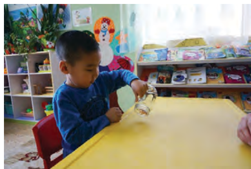
Хүүхэд савнаас эд зүйлийг гаргаж авах