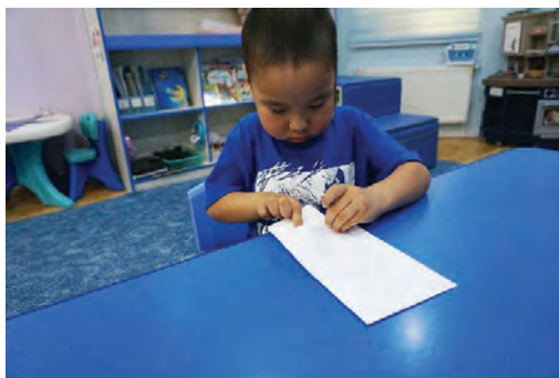
Нугалсан цаасаа дугтуйд хийх