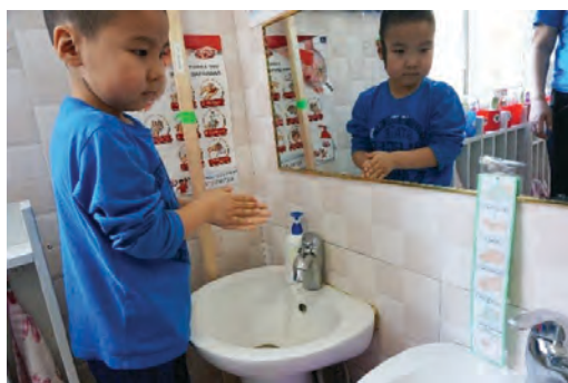
Гар угаах зурагт картыг харангаа гараа угаах