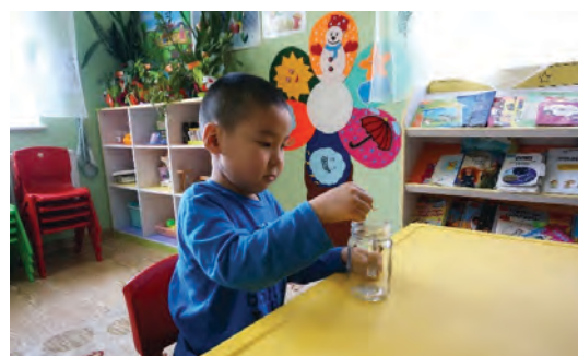
Хүүхэд гаргаж авсан юмаа буцааж саванд хийх. Хийж чадвал магтах