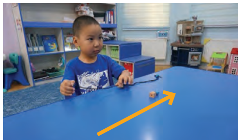
Багшийн хийснийг хүүхэд дуурайж хийх