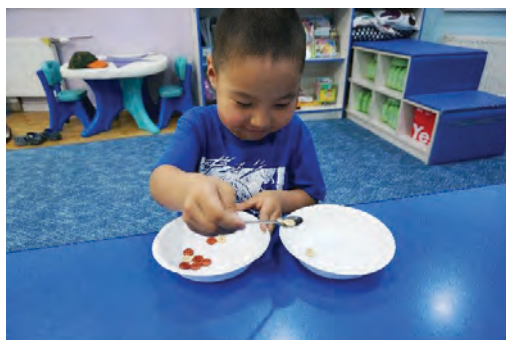
Халбагаар эд зүйлийг нэг тавагнаас нөгөө таваг уруу хийх