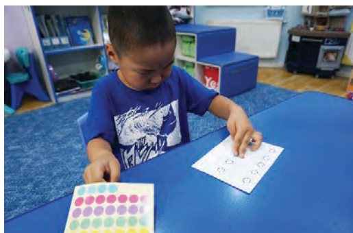
Жижиг наалтыг хүрээн дотор наах