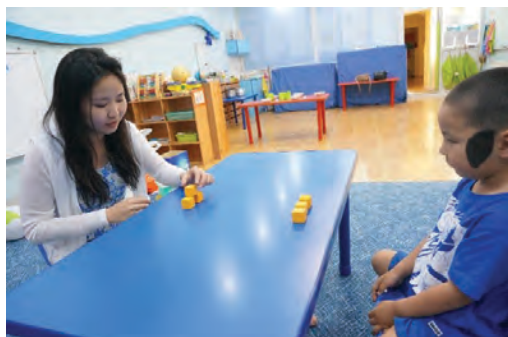
Багш хэрхэн шоо өрж байгааг хүүхэд ажиглах