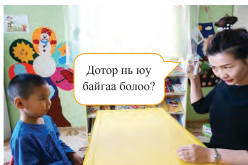
Багш савыг сэгсэрч юм байгааг анхааруулж хамтдаа гаргаж авах