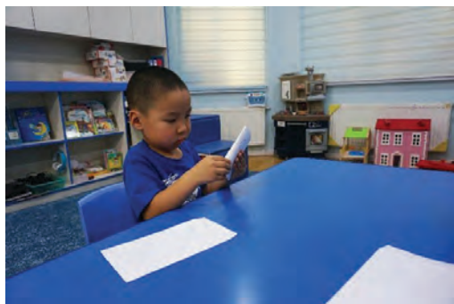
Хүүхэд цаасыг дундуур нь нугалах