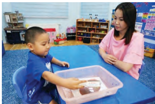
Сургалтын хэрэглэгдэхүүнийг хэрэглэж дууссаны дараа сагсанд хийх