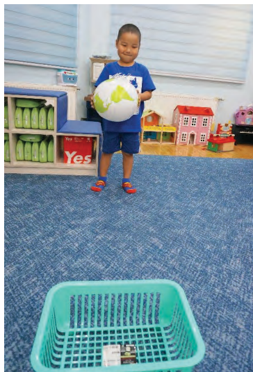
Сагсыг бага багаар холдуулах