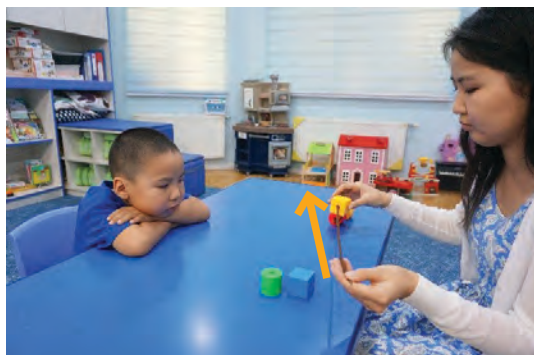
Том хэмжээтэй дүрсний нүхээр уяа сүвлэх