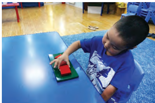
Хэвэнд дөрвөлжин дүрсийг хийх