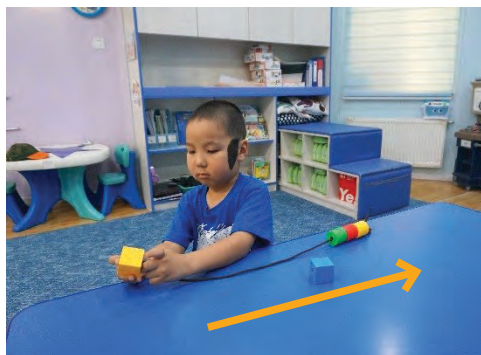
Хүүхэд даган дуурайж хийх