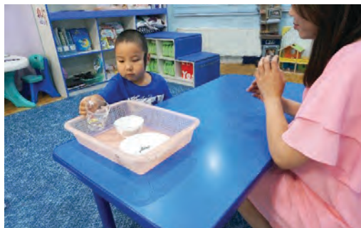
Хооллосны дараа аяга тавгаа хураах