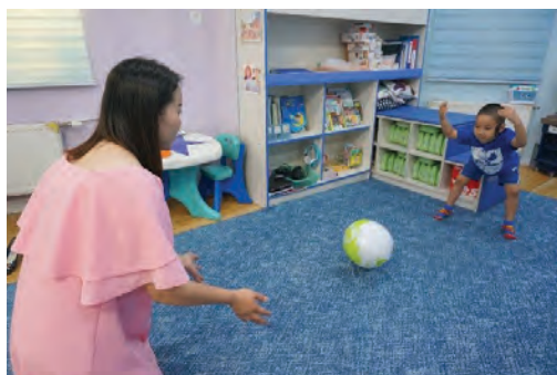
Том бөмбөгийг өнхрүүлэх