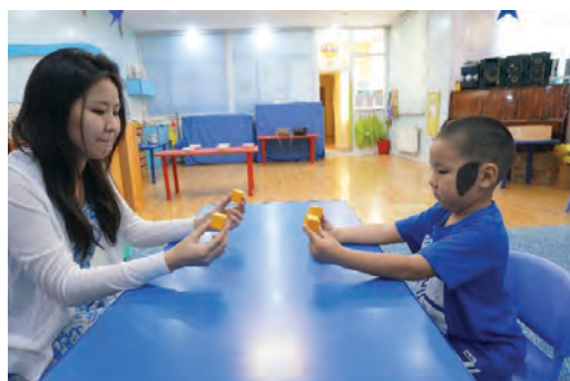
Багш, хүүхэд аль аль нь хоёр гартаа нэг нэг модон шоо барих