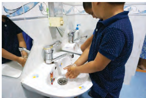
Гоожиж буй усанд гараа норгох