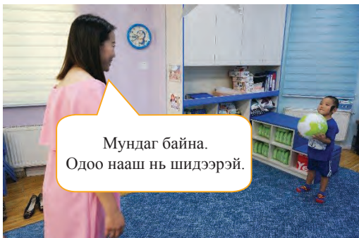
Хүүхэд барьж авсан бөмбөгөө багш руу буцааж шидэхийг хүсэх