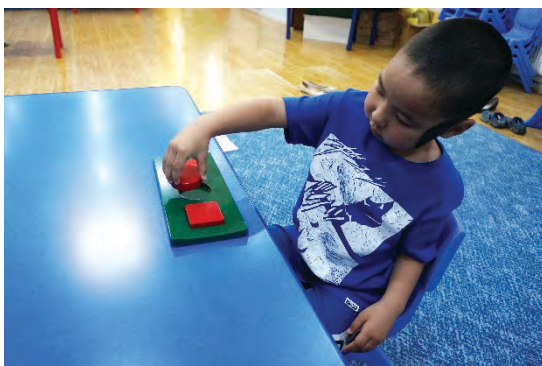
Хэвэнд дугуй дүрсийг хийх