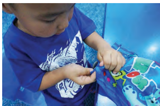
Уутны товчийг нь тайлж, доторх зүйлийг гаргах