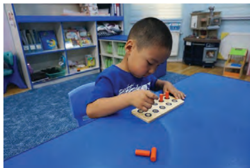
Хүүхэд “Пэг” тоглоомын сууринаас дүрсээ гаргах