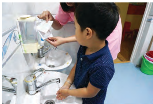
Зааврыг харж гараа угаах