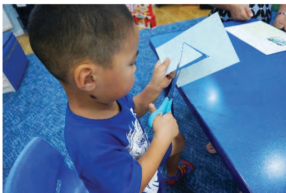
Зураасны дагуу гурвалжин дүрсийг хайчлах