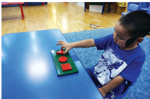
Хэвэнд гурвалжин дүрсийг хийх