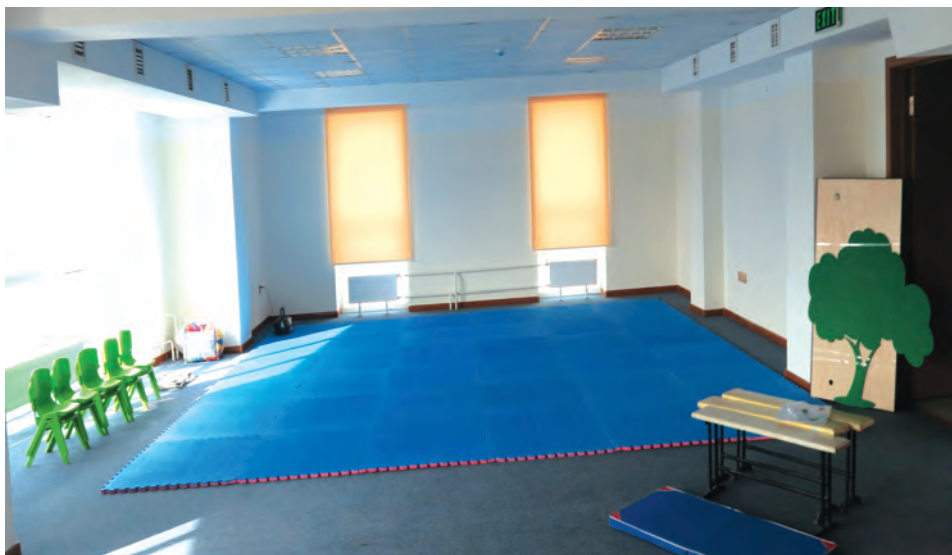
Зураг 1. Зохион байгуулах танхим