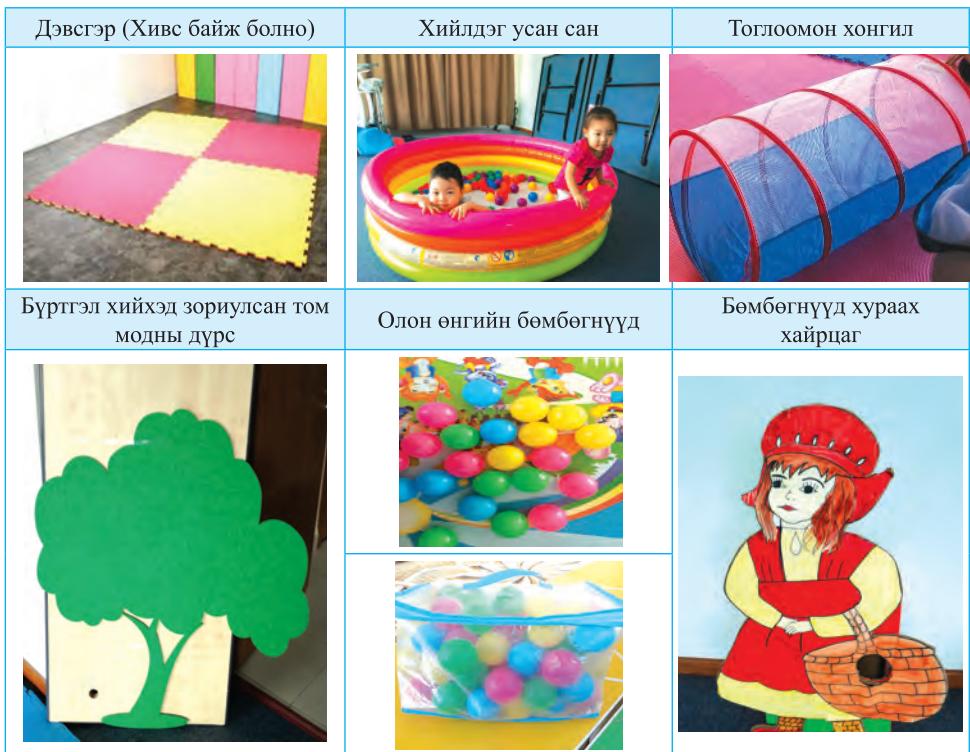
Зураг 2. Хэрэглэгдэхүүний жишээ