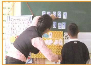
Тусгай сургуулийн хичээл

Мөн хөгжлийн бэрхшээлтэй хүүхдүүд гэртээ ойр ердийн сургуульд сурч байна. Тус төслийн хүрээнд тусгай сургуулиудын багш нараас ердийн сургалттай туршилтын сургуулиудын багш нарт зөвлөн туслах үйл ажиллагааг дэмжин ажиллаж байна.