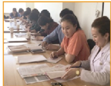
“Эх хүүхдийн эрүүл мэндийн дэвтэр”-ийг ашиглахад чиглэсэн семинар зохион байгуулав.