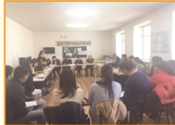
Хичээлийн дараах хэлэлцүүлэг (2016.03 сар)