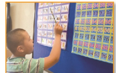
Дээрх бичил төсөл хэрэгжүүлэх хугацаа: 2016.06 сараас 2017.05 сар хүртэл