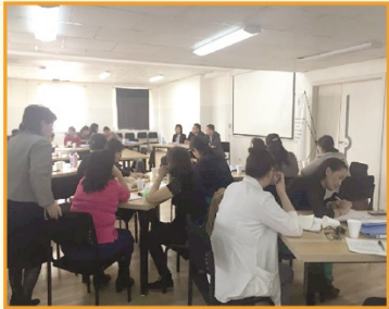
Баянгол дүүрэгт хөгжлийн үнэлгээ, дэмжлэгт хамруулах сургалт зохион байгуулав.

Зорилтот аймаг/дүүрэгт холбогдох байгууллагын зүгээс ХБХ-ийн үнэлгээ, хөгжлийн дэмжлэг үзүүлэх чадавхийг бэхжүүлэх үйл ажиллагааг зохион байгуулж байна. Одоогийн байдлаар хөгжлийн үнэлгээ, дэмжлэгт хамруулах сургалт, хүүхдийн хөгжлийн бэрхшээлийг эрт илрүүлэхэд “Эх хүүхдийн эрүүл мэндийн дэвтэр”-ийг үр дүнтэй ашиглахад чиглэсэн үйл ажиллагаануудыг зохион байгуулаад байна.