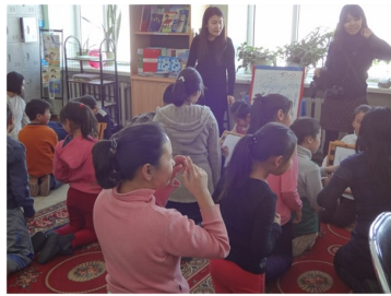
Хөгжлийн бэрхшээлтэй болон бэрхшээлгүй хүүхдүүд хамт тоглож буй байдал

26-р сургууль нь Нийслэлийн төвөөс 35 км зайтай орших Хан-Уул дүүргийн Туул тосгонд байрладаг. 2015 оны 12 сарын 20-нд /Ням/, тус сургуульд ойрхон амьдардаг хөгжлийн бэрхшээлтэй хүүхдүүдийг сурагчидтай танилцуулах арга хэмжээг зохион байгууллаа.