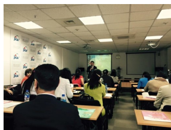
Япон дахь сургалтын үр дүнг тайлагнах уулзалт