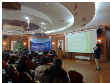
Японы тэгш хамруулан сургах боловсролын талаар танилцуулав

2015 оны 12 сарын 21-22-нд Нээлттэй нийгэм форум ТББ-аас “Хөгжлийн бэрхшээлтэй хүүхдийн боловсрол форум”-ыг зохион байгуулав.