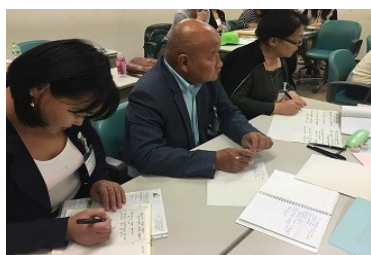
Япон дахь сургалтын лекц сонсож буй байдал

ICF-г ашиглан хүүхэд "А"-гийн төлөв байдалд дүн шинжилгээ хийж үзвэл, энэ хүүхдийн сул тал төдийгүй, давуу талуудыг нь ч анзаарч болно. Мөн зөвхөн сэтгэл санаа, бие махбодын үйл ажиллагаа, бүтцэд нь анхаарал хандуулалгүйгээр хүрээлэн буй орчны хүчин зүйл зэрэгт нь дүн шинжилгээ хийх замаар “Нийгмийн оролцоо” хэмээх эцсийн зорилгод хэрхэн хүргэх арга замыг эрэлхийлэн судлах боломжийг олгодог. Тухайн хүүхдийн талаарх ерөнхий зураглалыг гаргах боломжтой гэсэн үг юм. Жишээлбэл, хүүхэд "А"-г “Өөрөө дэлгүүр явж чаддаг болгох” гэсэн зорилт тавьж, бүс нутгийн оршин суугчдын дунд энэ талаар ухуулан тайлбарлах, хүүхэд "А"-гийн гэр бүлд сургалт, зөвлөгөө өгөх зэрэг арга замыг бодож олох боломжтой.