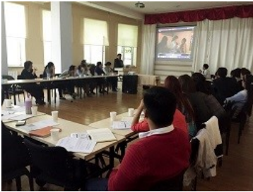
“Хөгжлийн бэрхшээлийн эрт илрүүлэлт, оролцоо”-ны талаар Японы туршлагыг танилцуулав

“Хөгжлийн бэрхшээлтэй хүүхдийн эрүүл мэнд, боловсрол, нийгмийн хамгааллын комисс /ХБХЭМБНХК/” нь хөгжлийн бэрхшээлтэй хүүхдийн эрт илрүүлэлт, эрт оролцоог хангахад дэмжлэг үзүүлэх зорилго, чиг үүрэг бүхий байгууллага бөгөөд 2014 оны 06 сард ХАХНХЯ-ны харьяа Сэргээн засалт хөгжлийн үндэсний төвийг түшиглэн ХБХЭМБНХ-ын Төв комисс, Нийслэлийн 9 дүүрэг, 21 аймагт Салбар комиссуудыг байгуулжээ.