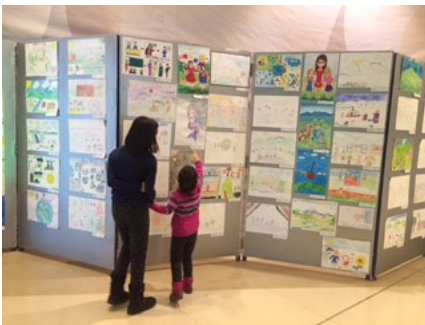
Гар зургийн үзэсгэлэн

Мөн оны 11 дүгээр сарын 29-нөөс 12 дугаар сарын 13-ны өдрүүдэд БСШУСЯ болон ХНХЯ-наас Шангри-Ла төвд гар зургийн үзэсгэлэн гаргасан бөгөөд иргэд олноор хүрэлцэн ирж, хүүхдүүдийн бүтээлийг үзэж сонирхлоо. Үзэсгэлэнгийн санал сэтгэгдлийн дэвтэрт “Хөгжлийн бэрхшээлтэй хүүхдүүдийн дүрсэлсэн ертөнцийг харахад сэтгэл ариусч байна”, “Хүүхдүүдийн зурсан зураг яагаад ч юм дотно санагдаж, хүүхэд ахуй үеийг минь бодогдууллаа” гэх зэргээр сэтгэгдлээ бичиж үлдээжээ.