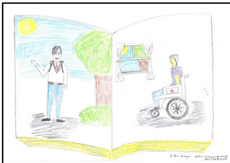
Э.Энххалиуны бүтээл (15 нас)