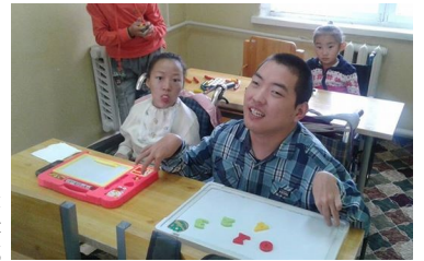
Орхон аймгийн Насан туршийн боловсрол олгох төвд суралцаж байгаа хүүхдүүд

Мөн 2017 оны 03 дугаар сард, 2017 оны 06 дугаар сараас шинээр хэрэгжүүлэх бичил төслүүдийн сонгон шалгаруулалтыг зарлахаар төлөвлөж байна.