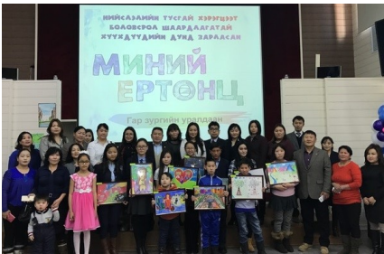
Шагнал гардуулах ёслолд оролцогчид дурсгалын зураг татуулав

2016 оны 11 дүгээр сарын 26-ны өдөр БСШУСЯ-нд шагнал гардуулах ёслолын ажиллагааг зохион байгуулж, уралдаанд байр эзэлсэн хүүхдүүд, тэдний ар гэр, салбар комиссын гишүүд, тусгай сургуулийн багш нар зэрэг 50 орчим хүн оролцсон. ХНХЯ-ны Хүн амын хөгжлийн газрын дарга, БСШУСЯ-ны Суурь, бүрэн дунд боловсролын хэлтсийн дарга, Японы ЭСЯ-ны хоёрдугаар нарийн бичгийн дарга, ЖАЙКА-гийн Монгол дахь төлөөлөгчийн газрын суурин төлөөлөгч, төслийн ерөнхий менежер нар байр эзэлсэн хүүхдүүдэд өргөмжлөл, үнэ бүхий зүйл гардуулсан.