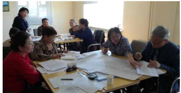
Кэйс хэлэлцүүлгээр боловсруулсан дэмжлэг, үйлчилгээ үзүүлэх төлөвлөгөөний жишээ

Салбар комисс төвтэй кэйс хэлэлцүүлгийг зохион байгуулснаар аль болох олон хөгжлийн бэрхшээлтэй хүүхдийг цэцэрлэг, сургуульд хамруулах боломжтой болно.