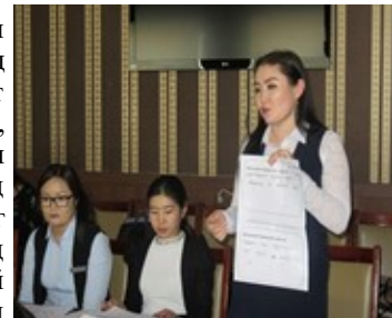
“Хөгжлийн бэрхшээл гэж юу вэ?” гэсэн асуудлын талаар харилцан ярилцлаа