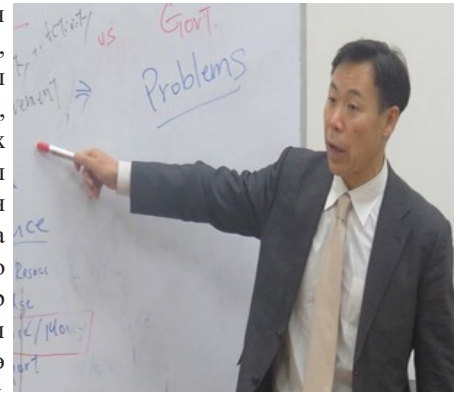
DPUB Ахлах зөвлөх Чуба Хусао