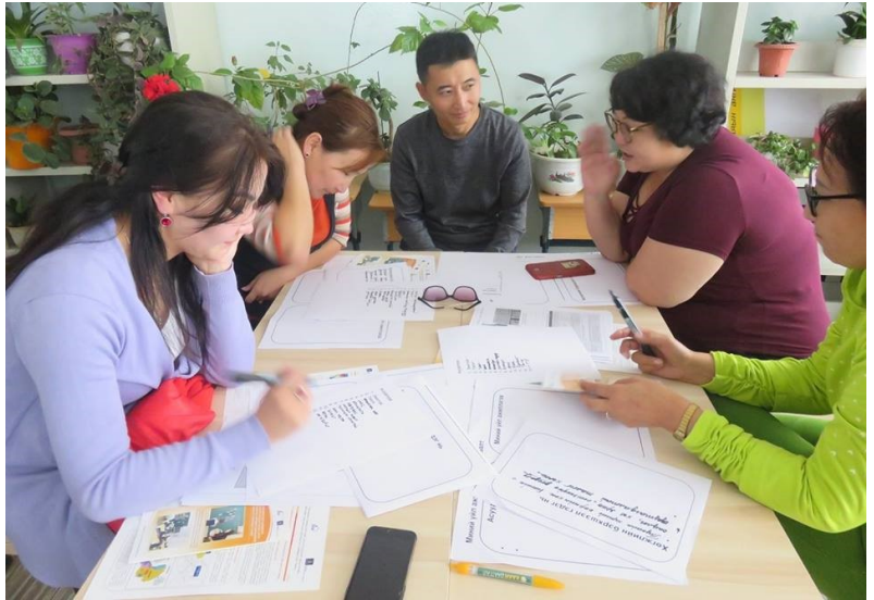
Багийн чиглүүлэгч багш “хөгжлийн бэрхшээл”-ийн талаар оролцогчидтой ярилцаж байна.

Боловсролын салбарынхан хөгжлийн бэрхшээлийн нөлөөллийн сургалтанд хамрагдлаа. (2018.09.13)