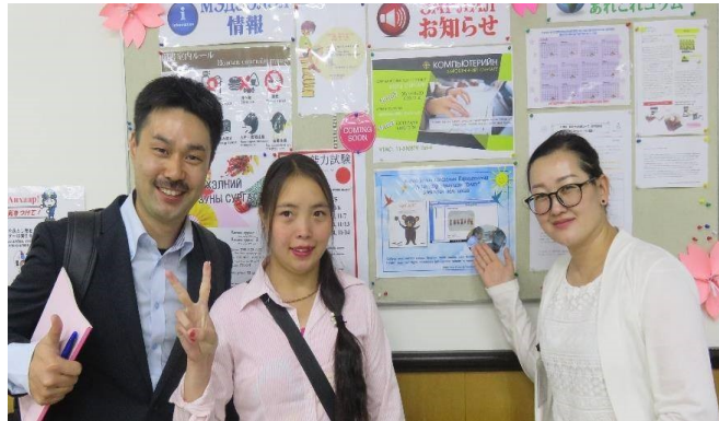
Хигашида мэргэжилтэн Заяатай хамт Монгол-Японы төвийн номын сантай танилцлаа.

Та бүхэн Daisy (Дэйзи) гэж сонсож байсан уу? Энэ үг нь Digital Accessible Information System гэсэн үгийн товчлол бөгөөд хүртээмжтэй мэдээллийн систем юм. Тухайлбал хэвлэмэл материал уншихад хүндрэлтэй хүмүүс ч гэсэн ашиглах боломжтой