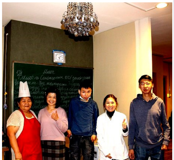
Тогоочийн ангийн багш, сургуультай танилцахаар ирсэн зочид, DPUB2 төслийн ажилчид дурсгалын зураг даруулав.

Сайны хажуугаар бэрхшээлүүд ч бий. Хувийн хэвшлийн байгууллагуудад төр, төрийн байгууллагатай хамтарч ажиллах боломж бага байдаг гэнэ. DPUB2 төсөл нь энэхүү асуудлын хүрээнд хөгжлийн бэрхшээлтэй иргэдийн хөдөлмөр эрхлэлтийг дэмжин ажилладаг байгууллага, хувь хүмүүсийн талаар идэвхийлэн мэдээлэл цуглуулж, хоорондын сүлжээг бэхжүүлэн ажиллахыг зорьж байна.