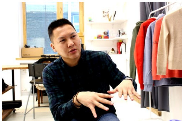
7-694 брэндийн үүсгэн байгуулагч, захирал Түвдэн