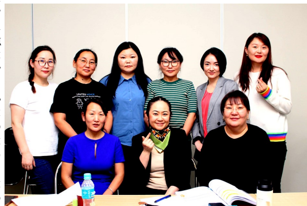
Ажлын байрны дадлагажуулагч бэлтгэх 8 сургагч багш

Харин 3-р сарын ажлын байрны дадлагажуулагч бэлтгэх сургалтад найман сургагч багш нар өөрсдөө хичээл заах юм. Энэ удаагийн сургалтаар нийт 36 ажлын байрны дадлагажуулагч бэлтгэх төлөвлөгөөтэй байна.