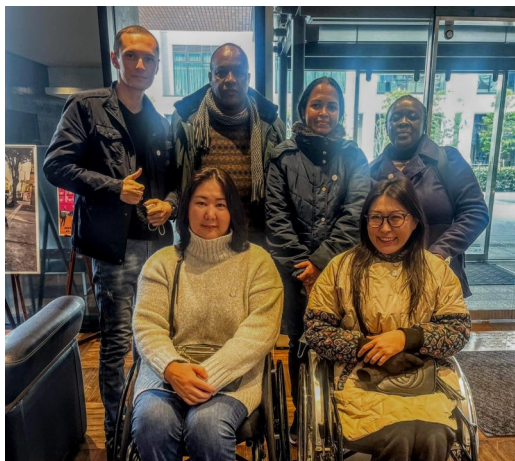
ЖАЙКА-ын сургалтад оролцогчид

Сургалт 2-р сарын 2-нд өндөрлөх бөгөөд хөтөлбөрөөс суралцсан зүйлсээ эх орондоо хэрэгжүүлэхээр нутгийн зүг хөдлөх болно. Монгол улсаас оролцож байгаа хоёр оролцогч маань шинэ мэдлэг, эрч хүчээр дүүрэн ирнэ гэдэгт итгэж байна.