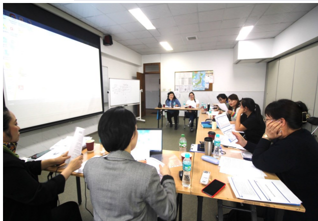
8 сургагч багш хэлэлцүүлэг хийж байна

1-р сарын 30-аас 2-р сарын 1-ний өдрүүдэд ажлын байрны дадлагажуулагч бэлтгэх 8 сургагч багш нар, “Ажлын байрны дадлагажуулагч бэлтгэх анхдугаар сургалт”-ын бэлтгэл ажлын талаар ярилцсанаас гадна Япон дахь сургалтын урьдчилсан сургалтад хамрагдлаа.