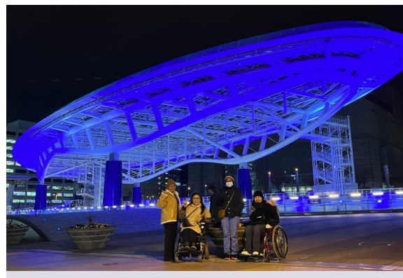
Чөлөөт цагаараа Нагоя хот