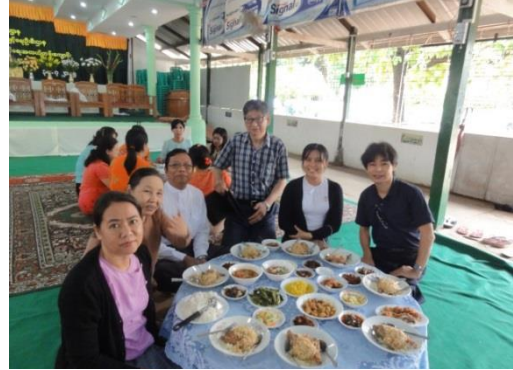
ヤンキン付属校でのお祭りの食事

ヤンキン教員養成校及び付属校でもそれぞれお祝いが執り行われ、CREATEの日本人専門家が招待されました。講堂では、学校関係者が一堂に集まり、おいしいミャンマー料理を頂きました。ミャンマー伝統の何種類ものカレーにスープ、それに新鮮な果物と甘いデザートをお腹いっぱい味わいました。