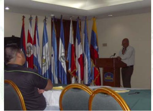
Intercambio de experiencias de República Dominicana