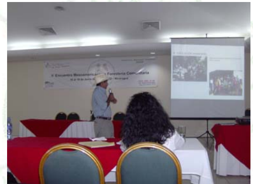
Intercambio de experiencias por beneficiario del Proyecto de Manejo Forestal Participativo