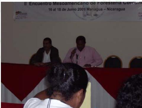
Firma de la Estrategia Nacional de Forestería Comunitaria por INAFOR