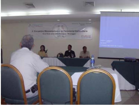
Mesa del principal en Inauguración del II Encuentro de Forestería Comunitaria