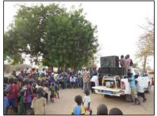
就学促進キャンペーンに集まった住民

しかし、6月から学年末休暇中の8月にかけては、CGE設立研修の実施に適しません。6月下旬の初等教育修了試験（CFEE）、CFEE終了直後に突入する事実上の学年末休暇、雨季開始に伴う農繁期、そして9月以降の教員異動の可能性など、さまざまな阻害要因があるからです。その時期に研修を強行しても、その後適切なCGE設立には至らないので、せめて9月以降に研修開始を延期できないかと、教育省と世界銀行に訴えました。残念ながら、10月から全国の小学校にCGE経由で交付金を交付したい教育省は、プロジェクトからの指摘には耳を貸さず、すでに教育省が動かせる別の資金を活用して、CGE設立研修を即時実施するようプロジェクトに指示しました。