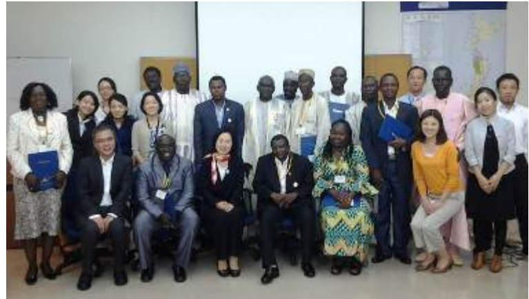
みんなの学校合同カウンターパート研修参加者一同で

「みんなでみんなの学校だより」は、ニジェール、セネガル、ブルキナファソで展開されている「みんなの学校プロジェクト」で起こっている事、活動で直面している問題をありのままに伝え、情報共有することを目的としています。