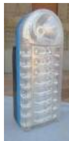
コミュニティが購入したランプ(左) PACOGES が購入したソーラーランプ(右)