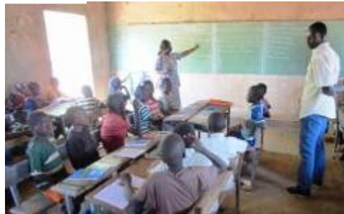
教員の負担を軽減するため、コミュニティから講師を募集。コミュニティ講師(右)