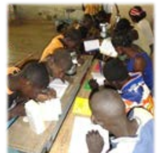
CEP 対策の為の夜間学習とランプ