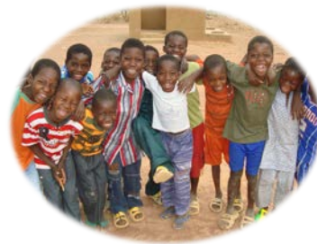
「マリ国 小学4年生の男子たち」

「みんなでみんなの学校だより」をお読みいただきましてありがとうございました。 このニュースレターで取り上げられているプロジェクトのHPアドレスは以下の通りです。