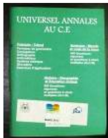
教育省によって出版された問題集を配布

プロジェクトでは、学習時間の増加、自己学習の内容強化を目的として3種類の補習「①空き時間を利用した全生徒を対象とした補習」「②学習不振児を対象とした補習」「③学校または地域における監督付夜間学習」を提案しました。活動の持続性に配慮し、これらの活動に求められる教員やコミュニティ講師のインセンティブは、基本的にコミュニティまたは参加する生徒の親に義務付けました。一方で、これらの活動に必要な問題集、夜間学習用のランプについては、各 COGES の活動予算化が終わっていることから、今回の試行においてのみ支援しました。これらの条件下、補習①は全10校で、補習②と③は6校において実施されました。