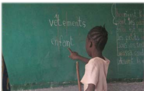
学習不振児を対象とした補習は初めての取り組み。学校によっては7割が対象に。