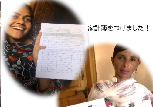
家計簿をつけました!