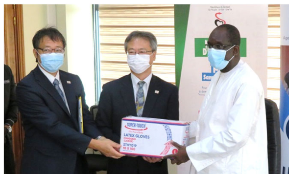
Cérémonie de réception des produits

Tenant compte de la propagation de la Covid-19, le PARSS2 a distribué des produits nécessaires à la lutte contre la Covid-19 au sein du Ministère de la Santé et de l'Action Sociale (MSAS), dans les huit régions cibles, au profit des régions médicales, des districts sanitaires, des centres de santé, des postes de santé, de l'ENDSS, de tous les sept (07) CRFS et enfin aux Centres de Traitement des Epidémies (CTE). L'objectif était d'appuyer la continuité des services des administrations sanitaires, et la fourniture correcte des services médicaux dans les établissements de santé. Une cérémonie officielle de remise de don destiné à appuyer la riposte contre la Covid-19 a eu lieu le 7 août 2020. Cela a été l'occasion, pour M. Tatsuo ARAI, Ambassadeur du Japon au Sénégal et M. Masakatsu KOMORI, Représentant Résident du Bureau de la JICA au Sénégal, de remettre les produits préparés par PARSS2 à M. Abdoulaye Diouf SARR, Ministre de la Santé et de l'Action Sociale .