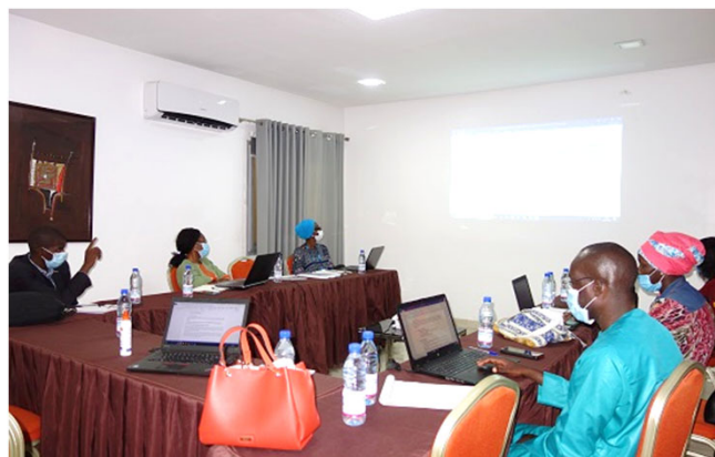
Travaux de groupe

L'atelier de relecture du Guide de planification du Ministère de la Santé et de l'Action sociale s'est tenu du 28 au 29 juillet. En raison de la Covid-19, ce Guide n'a pas été préalablement testé dans le cadre d'une phase d'essai. L'objet de l'atelier était de vérifier à nouveau les contenus et outils du guide afin de procéder à une mise à l'échelle test dès que possible en tenant compte de l'évolution de la pandémie. Cela a permis d'apporter des corrections telles que l'unification du style d'écriture de chaque chapitre et la vérification des documents joints. Ainsi le travail de confirmation s'est déroulé avec succès.