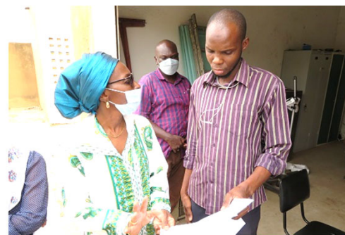
Mission de prospection au Centre de Santé de Khombole

L'outil de formation 5S a été techniquement validé l'année dernière, mais en raison de la Covid-19, la formation n'a pas été menée. Pour reprendre la formation, une mission de prospection a été menée au centre de santé de Khombole le 16 juillet avec la Direction de la Qualité, de la Sécurité et de l'Hygiène Hospitalières (DQSHH), et avec la participation du point focal national du PARSS2 de la DGSP. L'équipe de la mission a exploré l'ensemble du centre de santé de Khombole et a identifié des points d'amélioration sur l'environnement de travail du centre de santé et sur les mesures contre la pandémie de Covid-19. Le Médecin-chef du district sanitaire et les membres du Comité de Développement Sanitaire (CDS) ont également participé à la réunion, et confirmé les besoins d'une formation 5S. Ainsi, la formation 5S a été programmée dans le centre de santé de Khombole pour le mois d'octobre.