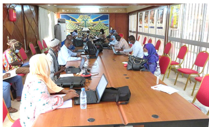
Réunion du Cadre de Concertation et de Coordination des interventions de PTF de la RM de Kaolack

Le PARSS2 a participé à la réunion du Cadre de Concertation et de Coordination des interventions des Partenaires Techniques et Financiers (PTF) de la Région médicale de Kaolack le 28 juillet. Au cours de la réunion, l'état d'avancement des activités de PARSS2 au premier semestre 2020, l'appui du projet à la riposte contre la Covid-19 et les plans d'action à dérouler ont été partagés. Cette réunion se tient régulièrement à l'initiative du Gouverneur et du Médecin chef de région de Kaolack. Cette fois-ci, des PTF tels que Abt-Associates, Enabel et KOICA ont participé à la rencontre. La réunion était très utile car elle a permis de vérifier le planning des activités de chacun et d'échanger des points de vues. Il est prévu de poursuivre cette étroite collaboration avec la région et les autres partenaires pour obtenir de meilleurs résultats.