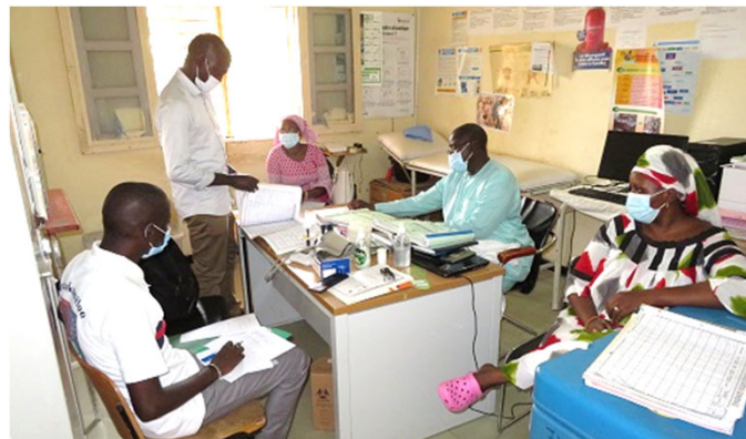
Audit de la qualité des données

Deux activités ont été menées dans la région de Fatick pour améliorer la gestion de l'information sanitaire. La première est l'Atelier de revue des données annuelles de 2019, qui s'est tenu du 11 au 14 août. Cet atelier avait pour but d'améliorer la qualité des statistiques sanitaires de 2019 de la région. A l'ouverture de cet atelier, le représentant de la Division du Système d'Information Sanitaire et Sociale (DSISS) de la Direction de la Planification, de la Recherche et des Statistiques (DPRS) a expliqué l'état actuel de la saisie des données et les erreurs notées au niveau de chaque district sanitaire dans le DHIS2 en 2019. Ensuite, des travaux de correction des erreurs signalées ont été effectués par chacun des huit (8) districts sanitaires. Lors de la restitution en plénière le dernier jour d'atelier, chaque district sanitaire a partagé les problèmes qui ont été soulevés au moment de la révision, et les points qui doivent nécessairement être améliorés à l'avenir. L'accent a été mis sur la nécessité d'améliorer le paramétrage dans la plate-forme DHIS2, et également sur la nécessité d'un suivi approprié au niveau du district sanitaire, de la région et au niveau central pour garantir la qualité des données DHIS2.