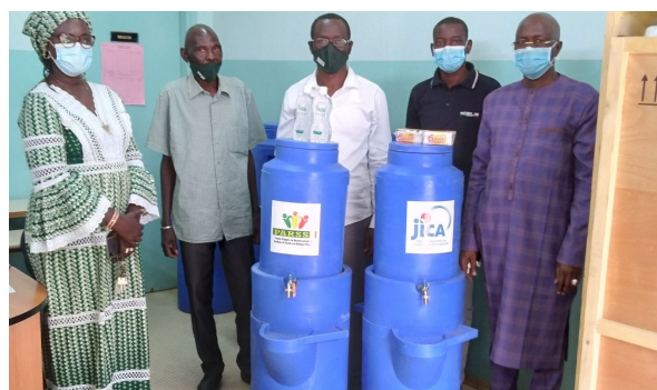
Distribution des produits à l'ENDSS