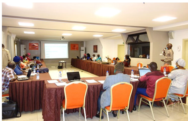
Atelier Relecture du Guide d'utilisation des outils de planification du Ministère de la Santé et de l'Action Sociale

Sur la base des résultats de l'atelier, la formation des formateurs sera organisée. Il est envisagé de continuer la formation auprès des parties prenantes afin que (1) le Document de Programmation Pluriannuelle de Dépenses (DPPD), (2) le Plan de Travail Annuel (PTA), (3) le Plan Opérationnel des Collectivités Territoriales-Santé et Action Sociale (POCT-SAS) et (4) le Plans d'Actions des Comités de Développement Sanitaires (PACDS) soient préparés en utilisant la maquette de planification appropriée conformément au processus normalisé, et que les activités soient réalisées à travers un suivi régulier.