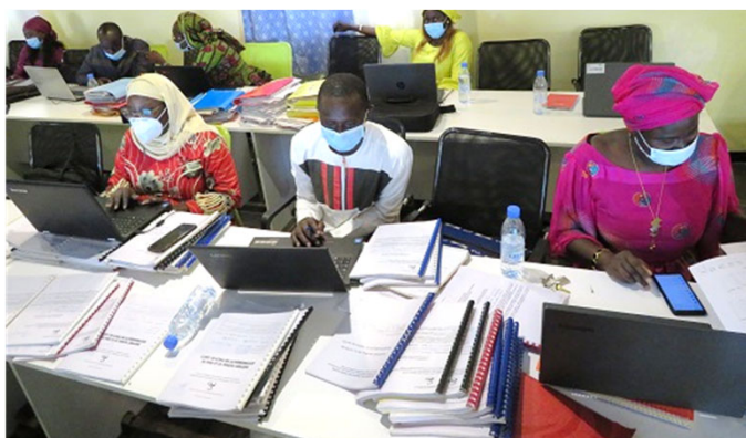
Atelier de revue des données annuelles de 2019

La seconde activité qui consistait en une mission d'Audit de la qualité des données du 1 er semestre de 2020 s'est tenue du 18 au 21 août. Les superviseurs qui se sont divisés en deux équipes, ont visité les centres de santé et les postes de santé des six (6) districts sanitaires en trois jours. Ils ont procédé à la vérification des contenus des registres au premier semestre 2020 et l'état de préparation et de soumission des rapports globaux de zone en utilisant la fiche d'audit préparée à l'avance. La dernière journée de mission a été consacrée au partage des résultats de l'audit par chaque district sanitaire. Cela a été l'occasion de mettre en évidence le fait que les rapports globaux de zone n'étaient pas préparés régulièrement, une incohérence entre le contenu des registres et des données saisies dans le DHIS2. En conséquence, la nécessité de valoriser les ressources humaines à travers la formation SIG (Système d'information aux fins de gestion) a été soulignée afin d'améliorer la qualité des données pour le second semestre de 2020.