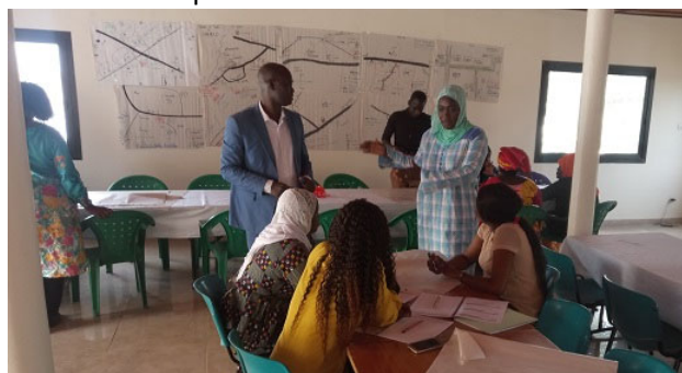
Formation sur les OGRIS au DS Popenguine, mars 2019