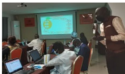
Atelier d'harmonisation sur les sessions de formations dans les régions

Ce processus s'est poursuivi au niveau régional par l'Atelier d'orientation des ECR et ECD de Fatick organisé les 28 et 29 janvier, et celui de Kaolack tenu les 11 et 12 février au profit des parties prenantes des régions et ceux de chaque DS. Ainsi, 31 facilitateurs ont été formés à Fatick et 23 facilitateurs à Kaolack. Partant de là, du mois de février à avril, 36 sessions de formation des membres de Comité de Développement Sanitaire (CDS) et des collectivités territoriales vont se tenir dans les deux régions. Les différents plans du secteur de la santé sont élaborés par chaque centre de responsabilité, du niveau communautaire au niveau central. Aussi, à travers ces orientations et les discussions menées, une compréhension harmonisée entre les acteurs impliqués dans le secteur de la santé pourrait être obtenue et conduirait à une bonne planification.