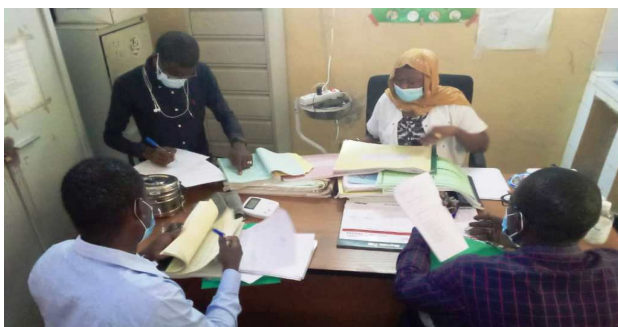
Audit de la qualité des données à PS Fimela

DHIS2/SIG : Deux activités de suivi de la gestion de l'information sanitaire ont été menées dans la région de Kaolack. La première activité est un « Atelier de revue des données annuelles de 2019 », qui s'est déroulé du 21 au 24 septembre 2020. Au début de l'atelier, la Division du Système d'Information Sanitaire et Sociale (DSISS) a expliqué l'état de saisie des données et les erreurs dans le DHIS2, puis chaque DS a corrigé les erreurs signalées en travaux de groupe. La deuxième activité fut l'Audit de la qualité des données dans la région de Kaolack, du 21 au 23 octobre 2020. L'équipe d'audit a visité chaque DS, un CS et deux Postes de Santé (PS) pour vérifier l'état de remplissage des registres et de saisie dans le DHIS2. Grâce à ces activités, les besoins en renforcement de capacités et de développement des ressources humaines vis-à-vis du Système d'Information aux fins de Gestion (SIG) de la région, du DS et du PS ont été confirmés afin d'améliorer la gestion de l'information sanitaire. Pour répondre à ces besoins, PARSS2 se prépare à élaborer un manuel du formateur sur le DHIS2 / SIG à le promouvoir lors des formations sur le DHIS2 / SIG qui se tiendront en 2021.