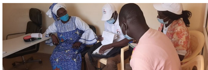
Visite de CDS du PS de Nguéniène,

les Préfets, les Sous-préfets et les Maires ont également assisté pour partager les problèmes auxquels font face les CDS et révélés lors de la supervision, mais aussi ont échangé sur les moyens nécessaires pour améliorer la gouvernance sanitaire. Au cours de ces discussions, il a été confirmé qu'il était nécessaire de renforcer les capacités de planification et d'administration du personnel des CDS. C'est la raison pour laquelle une orientation sur le Guide d'utilisation des outils de planification du MSAS est prévue à l'intention des acteurs impliqués des CDS dans les régions de Kaolack et Fatick de février à avril 2021. A travers des suivis post-orientation, le projet continuera à fournir un appui technique pour renforcer les capacités d'administration des CDS.