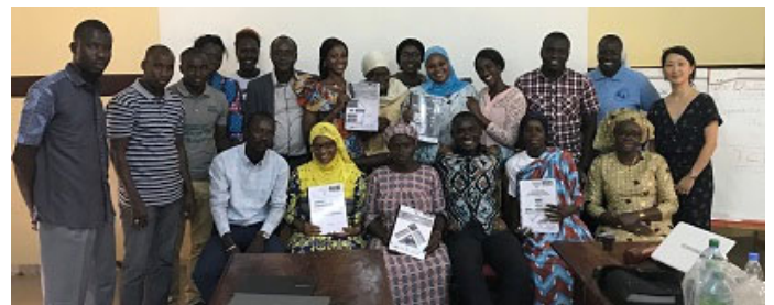
Formation sur les OGRIS au DS Ziguinchor, mars 2019

« La vérité se trouve dans le travail de tous les jours » et « L'essentiel est de bien faire son métier »