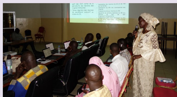
Mission de suivi post formation des acteurs des CDS à Fatick, septembre 2019