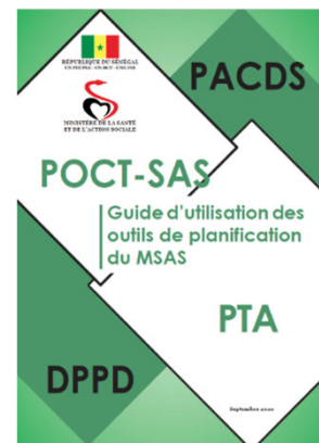
Guide d'utilisation des outils de planification du MSAS

Le Guide d'utilisation des outils de planification du Ministère de la Santé et de l'Action sociale (MSAS) a été validé techniquement à la fin de 2019. En raison de la propagation de la Covid-19, une orientation en utilisant les Guides n'a pu être organisée. Par contre, la préparation de l'orientation a commencé à partir du mois de septembre 2020. "L'atelier de formation des formateurs" s'est tenu du 17 au 18 septembre 2020. Il a été suivi de "L'atelier d'élaboration des modules et du plan de formation" organisé du 3 au 4 novembre 2020. Ces deux ateliers ont permis d'assurer la formation des formateurs et de concevoir des outils de formation. En plus, sur la base des feedbacks reçus de la part des participants durant ces activités, le Guide et la maquette ont été améliorés. Par la suite, les 19 et 20 janvier 2021, « l'Atelier d'harmonisation sur les sessions de formations dans les régions » a été organisé en invitant les planificateurs des 14 régions médicales, et les autres partenaires au développement. Cet atelier a été l'occasion de formuler un plan de formation à l'échelle nationale et d'orienter 31 facilitateurs potentiels en utilisant les nouveaux outils de formation élaborés.