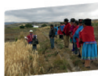
Extensión Tecnológica por Promotores Comunitarios (Día de Campo)