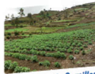
Multiplicación de Semillas Mejoradas en Parcela Comunitaria