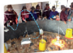
Cría de Especies Menores