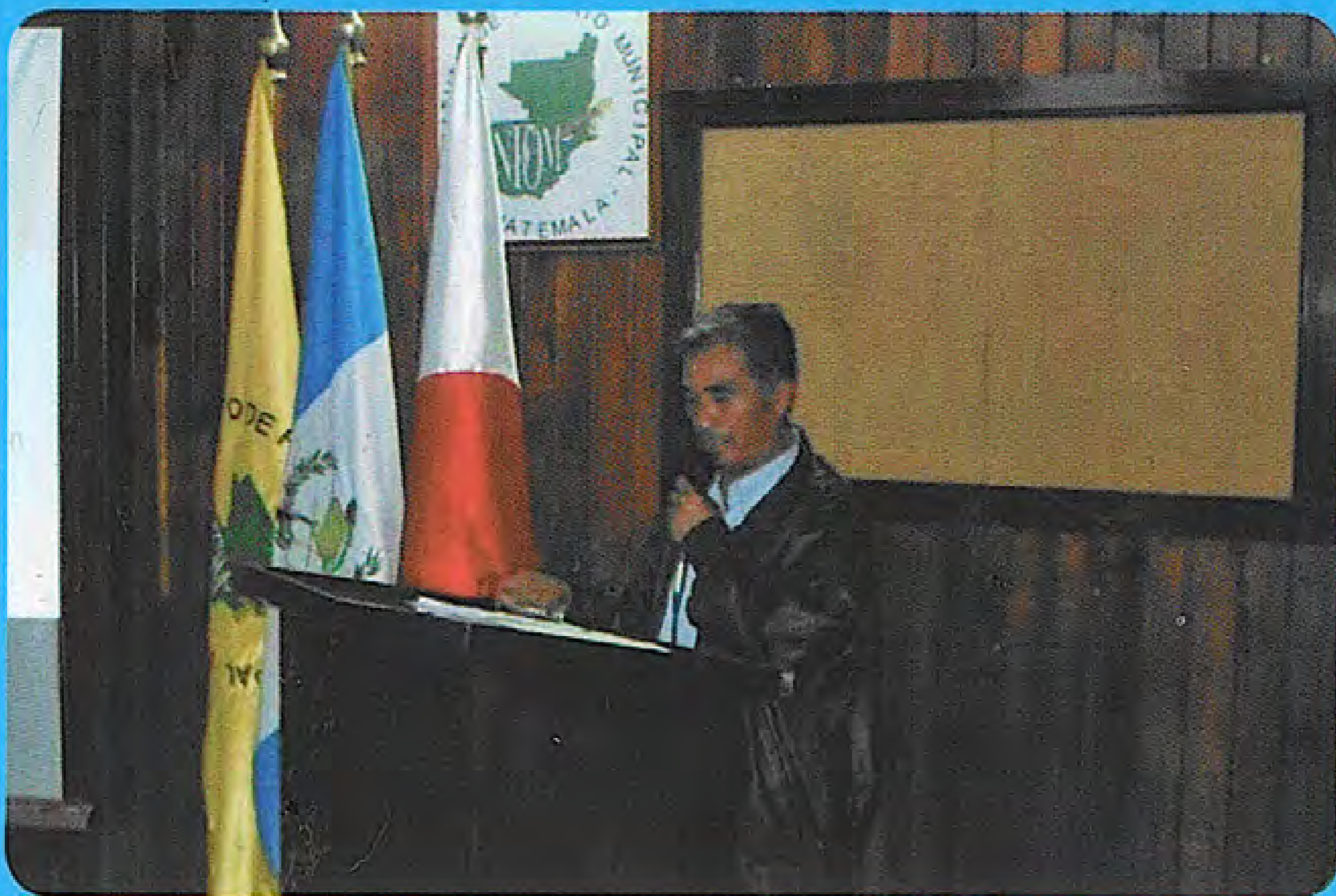
Exposición del representante de la Asociación de Agua de Los Encuentros