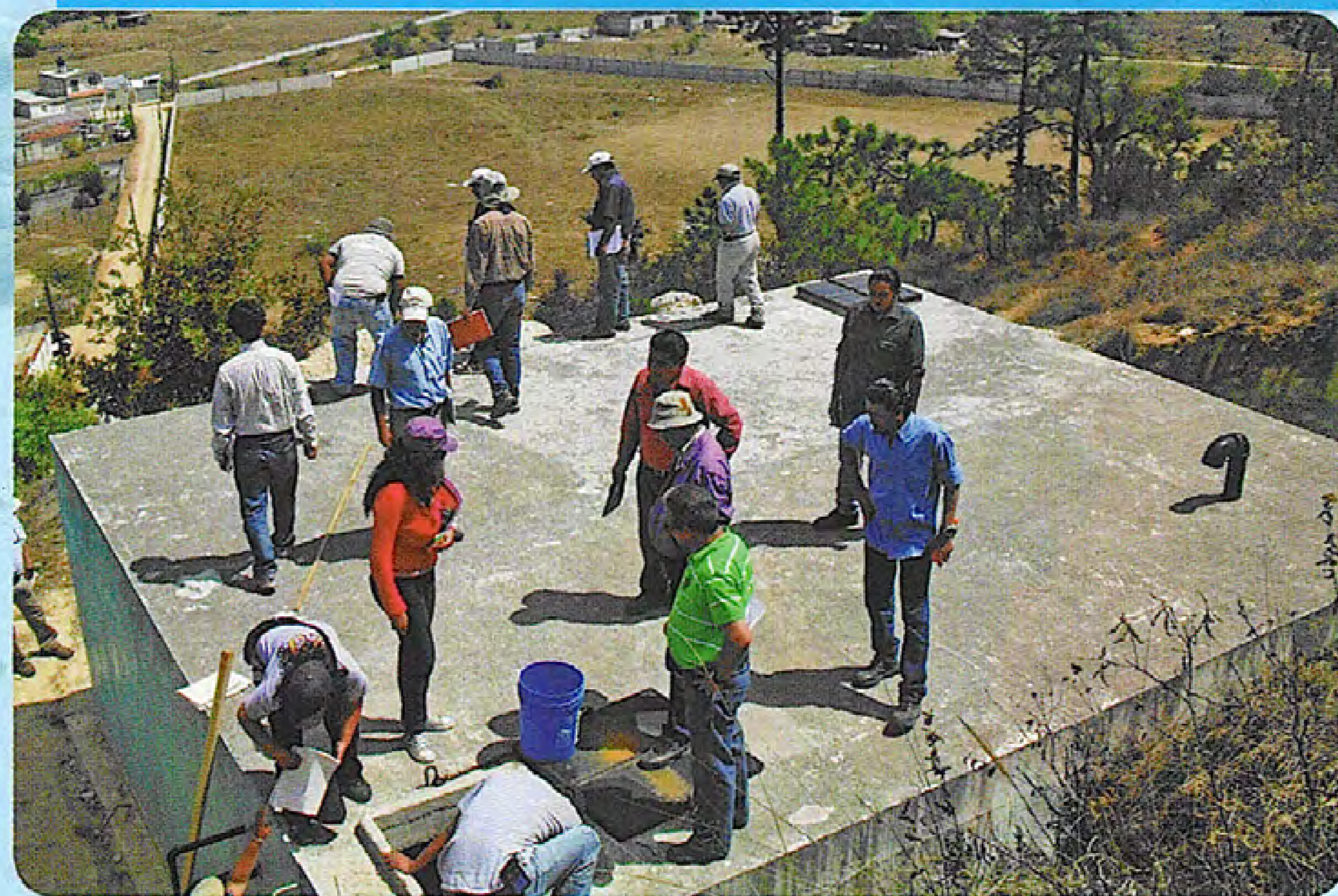
PROFADEC fortaleciendo las oficinas regionales con capacitación en campo

En este sentido el acompañamiento y la coordinación entre el personal de INFOM-UNEPAR y PROFADEC es de suma importancia para que el objetivo del proyecto se cumpla de forma satisfactoria y que el modelo del Plan de A O&M pueda replicarse en los otros proyectos que se ejecutan. La mala administración o la falta de interés de los integrantes de los Comités/ Asociación se traduce que en corto tiempo los sistemas de abastecimiento de agua fracasen.