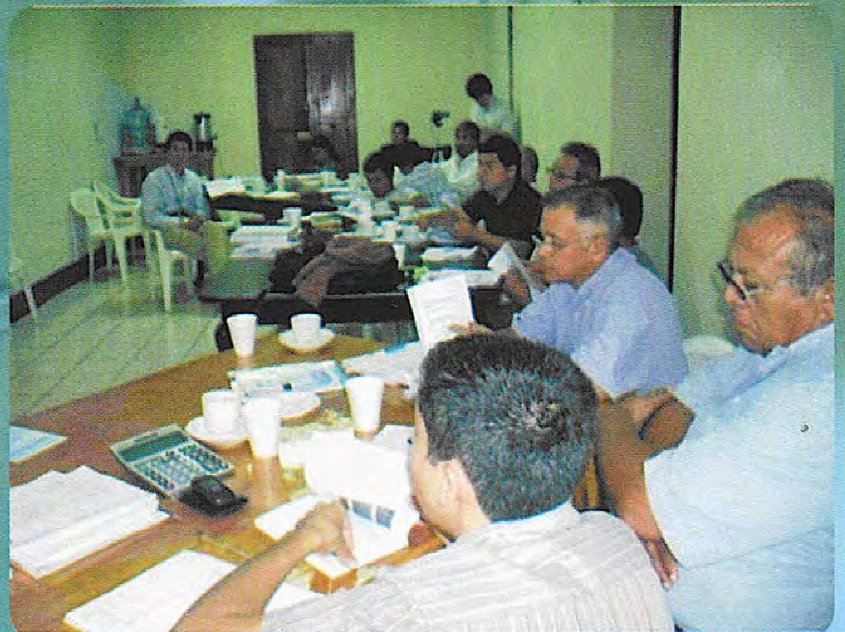
Ingenieros y Promotores Sociales se reunieron en el taller

K'iche' K'utb`anem re kajib` q`ij, wajxaqib` ik` re 2011