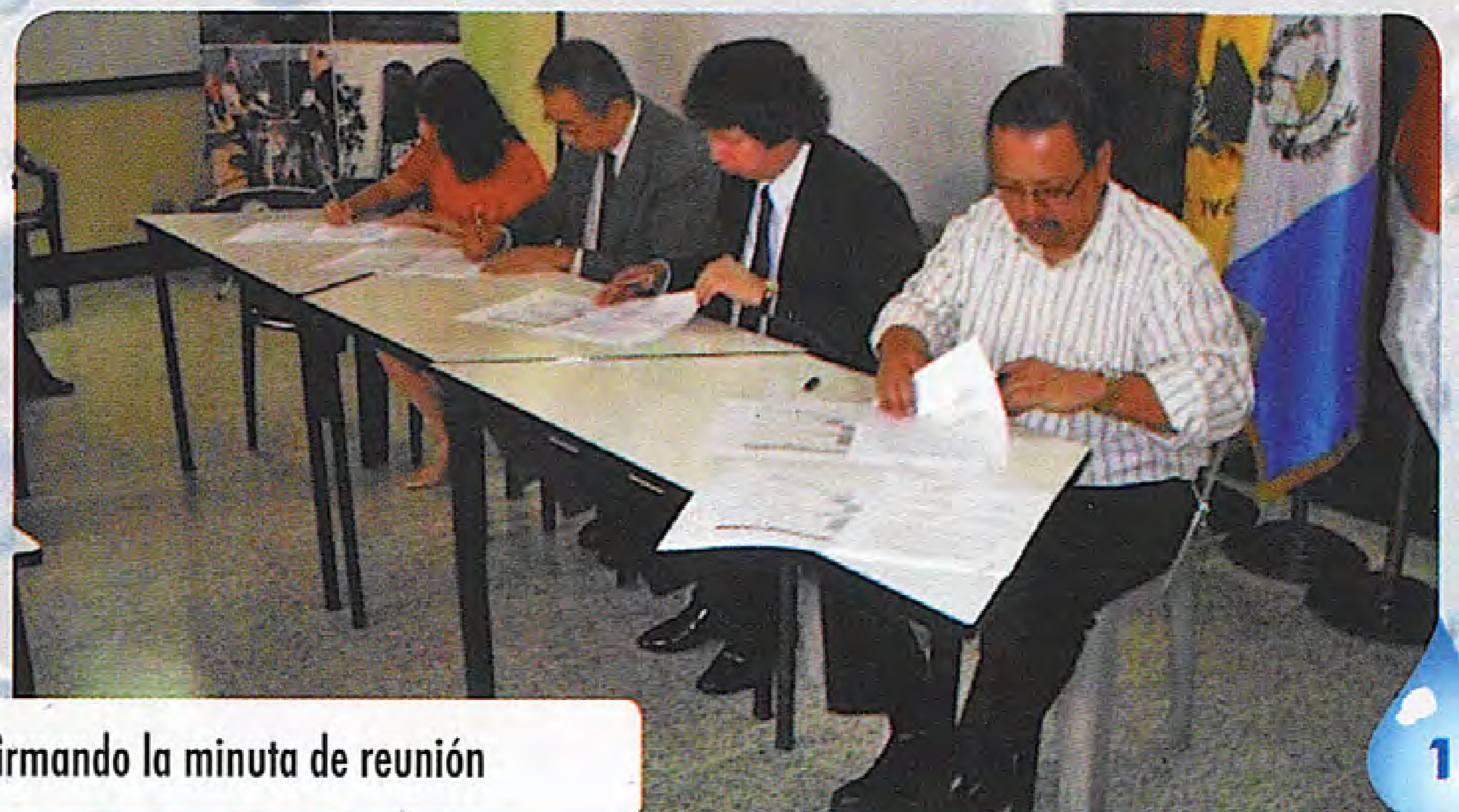
Representantes firmando la minuta de reunión

Pa ru k`isib`al che re molaj xech`on chij ri jalajoj taq tinamit anch`el ri pa Encuentros, Ri Giralda, Ri Sitio chuqa Pacorral Romaq`a Janina k`atzinel xikib`ij apon ri ki` tz`eton pe ri winaqil chij ri ch`olonem PROFADEC