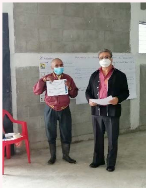
La Estanzuela, San Pedro Jocopilas