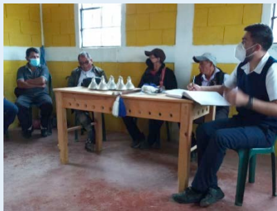
Comunidad Chuatzlic I, San Pedro Jocopilas