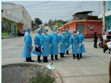
P/S El Caracol, Uspantan