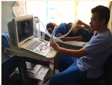
San Bartolomé Jocotenango