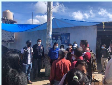
San Pedro Jocopilas