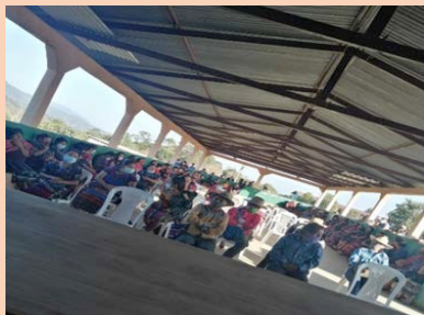
San Juan de los Llanos, Joyabaj