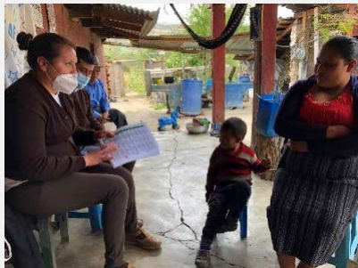
DMS San Pedro Jocopilas