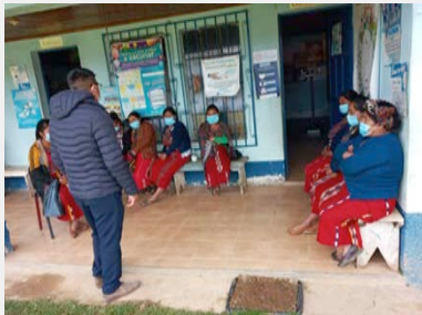
Puesto de Salud Vicalama, Nebaj