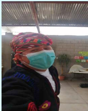
CAP San Pedro Jocopilas