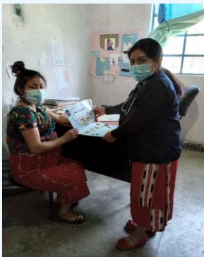
CC de Visán, Municipio de Nebaj