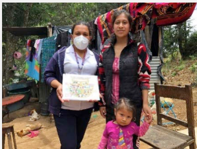
CAP San Pedro Jocopilas