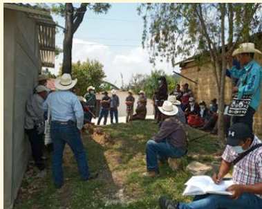
Puesto de Salud Chiaj Joyabaj