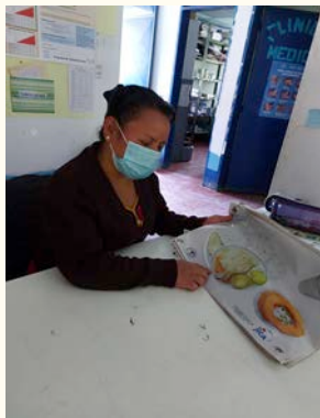
Puesto de Salud de Pulay, Nebaj