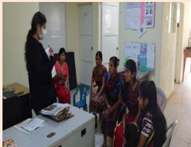
Centro de Recuperación Nutricional de Chajul