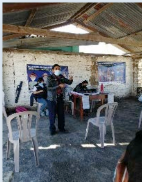
Cebollín, San Pedro Jocopilas