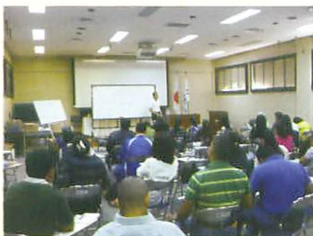
Docentes de las Escuelas Normales y FID-UPNFM

Además conocieron las modificaciones y sugerencias al Plan de Estudio de Educación Magisterial de la asignatura de matemática desarrollada en el 2009 y las estrategias de acompañamiento técnico a los pedagogos de las Escuelas Normales.