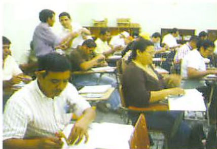
Docentes del Departamento de Cholulteca

“Este tipo de capacitación permite ver la matemática como una asignatura donde los niños y niñas van a aprender a resolver situaciones prácticas de la vida cotidiana, por ello el énfasis está en el desarrollo del pensamiento lógico matemático. Otro punto importante es que las capacitaciones se realizan tomando en cuenta los contenidos del texto, eso es bueno porque nos permite apoderarnos del proceso metodológico y además enterarnos de los cambios curriculares realizados actualmente. Uno de los contenidos más interesantes desarrollados en esta capacitación fue el de área y simetría. Cuando leí este contenido me pareció difícil, sin embargo los compañeros de PROMETAM los enfocaron de tal manera que todos sintiéramos el verdadero gusto por la matemática”.