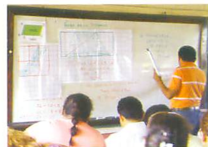
Docentes del Departamento de Cortés

“El someternos a un proceso de capacitación como este, viene a fortalecernos en una de las áreas más sensibles del currículo. Todos sabemos que la calidad de la enseñanza pasa por la actualización permanente de los docentes, particularmente esta capacitación permite aclarar muchas dudas relacionadas con la parte científica y didáctica de contenidos que son fundamentales para que el docente imparta una educación de calidad. Generalmente cuando vamos a estudiar estos contenidos con los niños y niñas planificamos la clase pensando en el docente y dejamos de lado a los protagonistas del proceso educativo. Es por ello que a través de esta capacitación se nos ha querido brindar las herramientas necesarias para que podamos enseñar la matemática basada en la experiencia de los niños y niñas”.