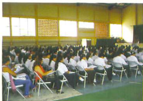
Participantes del Evento

El día 31 de agosto se realizó el Seminario Un paso hacia ¡Me gusta Matemática! ¿Cómo mejorar la enseñanza de matemática en el aula? en la Escuela Normal España Villa Ahumada de Danlí, El Paraíso, asistiendo un total de 250 personas entre estudiantes de la Licenciatura de Educación Básica y docentes de dicha escuela.