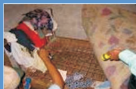
Busque alrededor de las camas