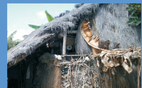
En los techos vegetales