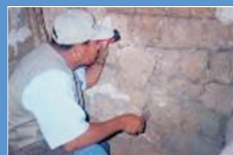
En las paredes