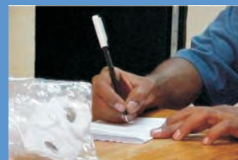
Coloque Nombre y dilección del jefe de familia