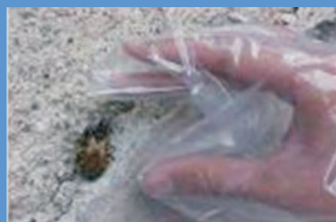
Meta las Chinchas en una bolsita plástica