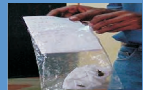
Cierre la bolsita plástica y no le abra agujeros