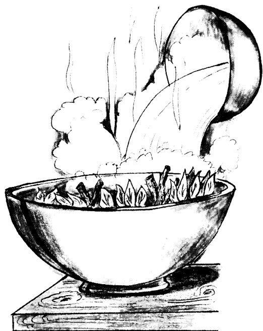
Té o infusión