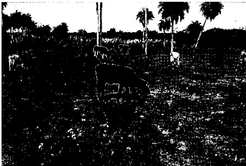
Foto 2: Animales pastoreando durante el invierno con restos de cultivo de algodón en San Roque González.

Porque durante el invierno faltan pastos para el ganado, y ante esta situación los agricultores acostumbran pastorear sus animales en su chacra, aprovechando los restos del cultivo anterior. Como consecuencia de esta práctica, el suelo queda sin cobertura favoreciendo la erosión, además la compactación y pérdida de fertilidad.