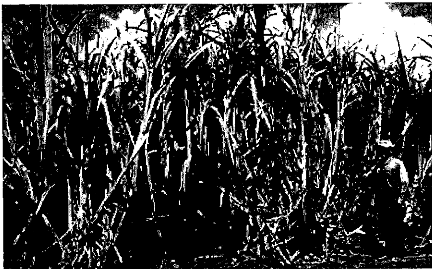
Foto 5: La Caña de Azúcar produce abundante cantidad y buena calidad de forrajes para el invierno.

Se debe renovar la plantación vieja cada 5 años y mantenerla limpia, para lograr buena producción.