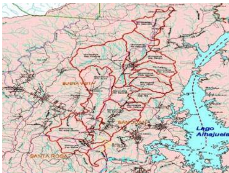
Figura 1. Ubicación de la sub cuenca del río Gatuncillo.

El silvopastoreo se presenta como una opción promisoriosa que por sus resultados y proyección constituyen un importante paso para incrementar la productividad y sostenibilidad animal en el trópico.