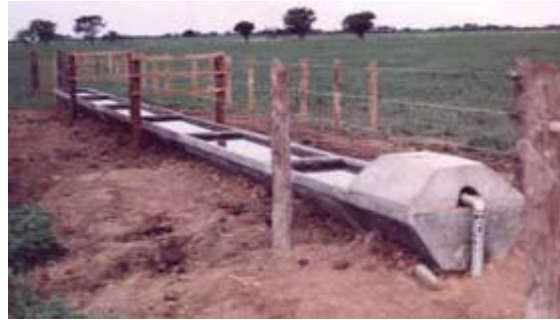
Figura 4: Bebedero de cemento

tendrá una duración entre dos a tres días, y se repetirán dos veces cada tema, de forma a cumplir con una población mayor a la meta. El contenido de las capacitaciones a desarrollar debe enfocarse en los siguientes temas: