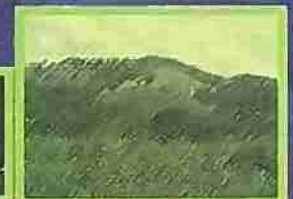
ZONA DE RECUPERACION NATURAL