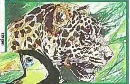
ZONA DE PROTECCION ABSOLUTA