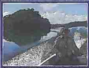
ZONA DE USO INTENSIVO