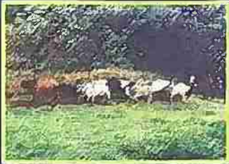
ZONA DE USO ESPECIAL