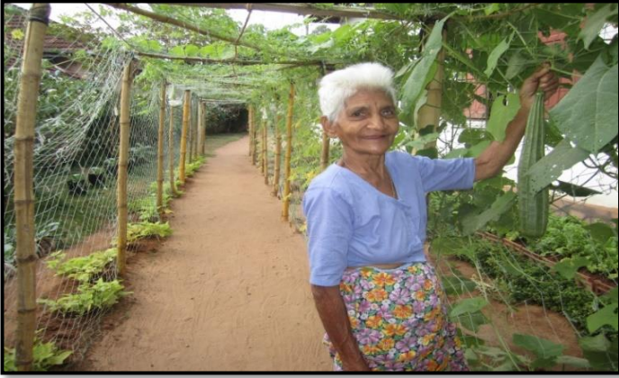
பயிர்ச்செய்கை – சுயதொழில்