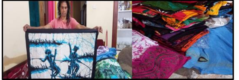
துணி மற்றும் பாடிக் (batik) வடிவமைப்பாளர் சுயதொழில் செய்பவர்