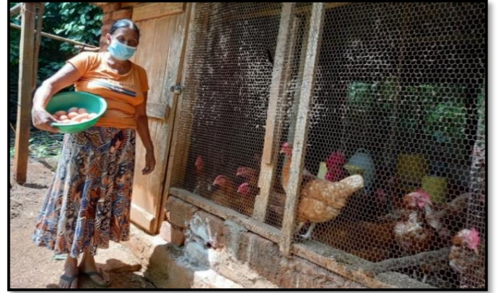
கோழி வளர்ப்பு – சுயதொழில்