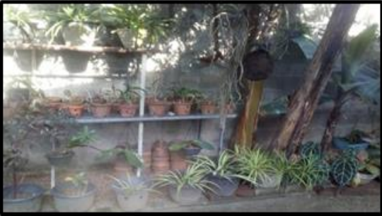
தாவர நாற்றங்கால் சுயதொழில்