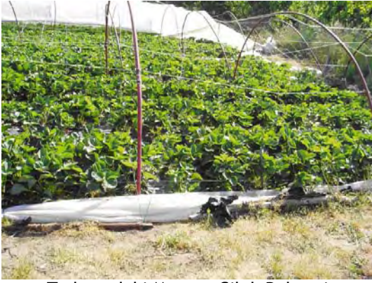
Trabzondaki Mevcut Çilek Bahçesi Present Strawberry field in Trabzon

following trials and demonstrations are planned to be implemented for the time being.