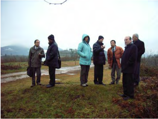
Proje Takımının alan incelemesi Field Investigation by the Project Team