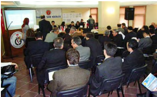
Katılımcı Komite Toplantısı JCC Meeting

Toplantıda, yapılan temel çalışmaların sonuçları ve proje uygulama planı açıklanıp tartışıldı. Yerel basında çıkan haberler yoluyla proje büyük ilgi yarattı.