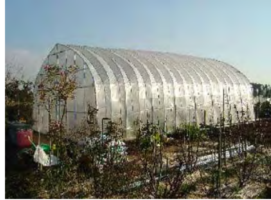
Boru Şeklinde Sera (Japonya) Pipe Greenhouse (in Japan)