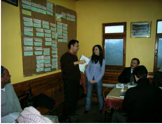
Köyde katılımlı atölye çalışması Participatory workshop in village

Bu bölgelerde model proje planlaması katılımcı yaklaşımla sürüyor. Bu yaklaşım Türkiye'de kullanılan karar mercininin Bakanlık olduğu yaklaşımlardan farklıdır. Katılımlı atölye çalışmaları köylüler ve eş uzmanlar eşliğinde yapılır.