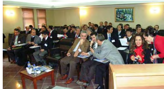
Katılımcı Komite Toplantısı JCC Meeting

In the meeting, results of the baseline studies and project implementation plan were presented and discussed earnestly. Through the articles in local newspapers, the Project attracted great attention from public.