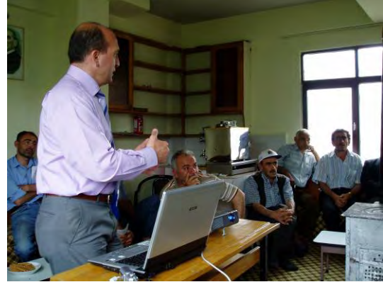
Projenin köylülere açıklanması Explanation of project concept to villagers

In the areas, planning of the model projects is going on in participatory approach. The approach is different from top-down approach, which is used to be adopted in Turkey. The participatory workshops are held with local people and counterparts.