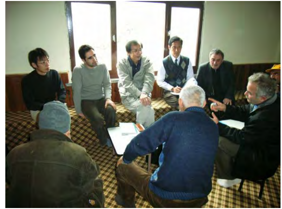
Danışman Grubu ve Çiftçiler Advisory Team and Farmers