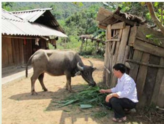
ディエンビエンドン郡 Hang Tro B 村