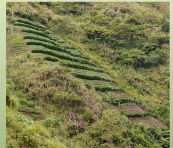
ひまわり (Sunflower) の一種を利用した等高線栽培