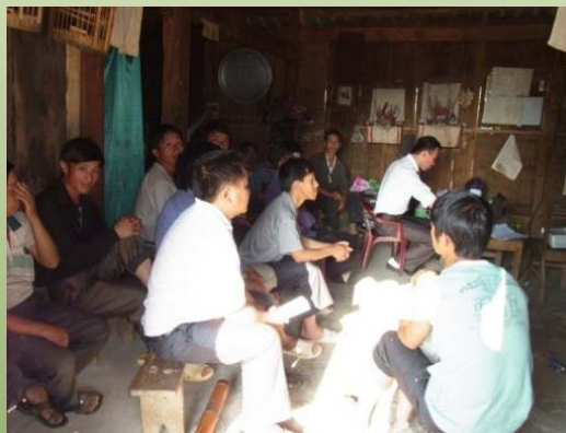
普及員によるパイロットサイトでの家畜の導入研修

能力向上にあたっては、OJT 方式による家畜の導入研修や非 OJT 方式によるスタディーツアーなどを予定しています。