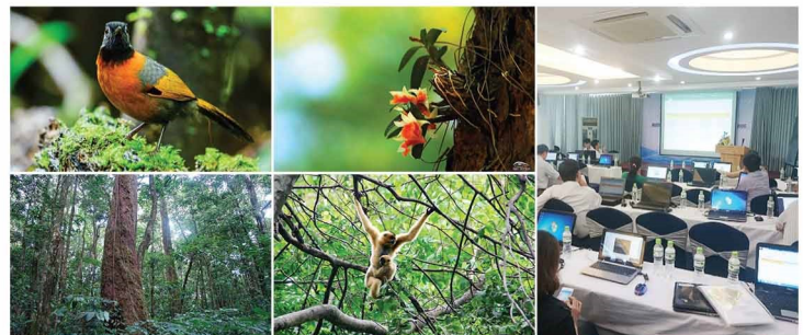
Tính đa dạng sinh học của Việt Nam