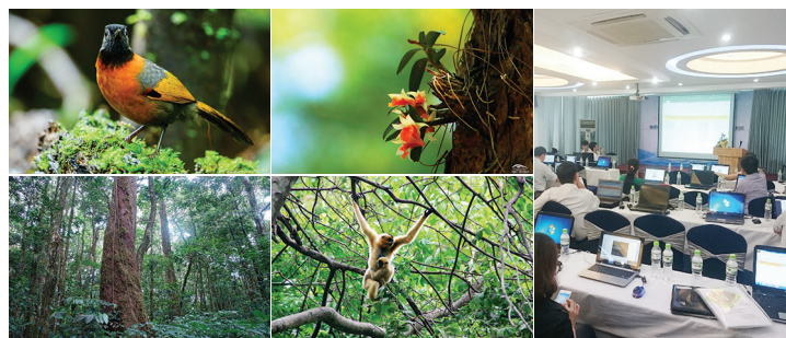
Rich biodiversity of Vietnam