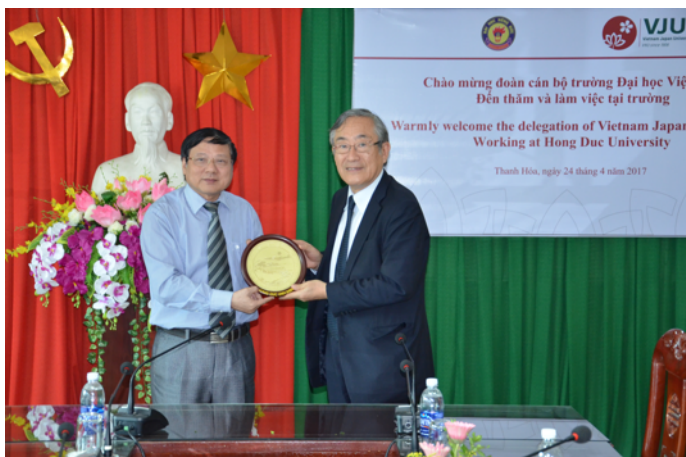
Hong Duc University での記念品の交換

Hong Duc University では約250人の学生が、Vinh University 約400人の学生が説明会に参加しました。