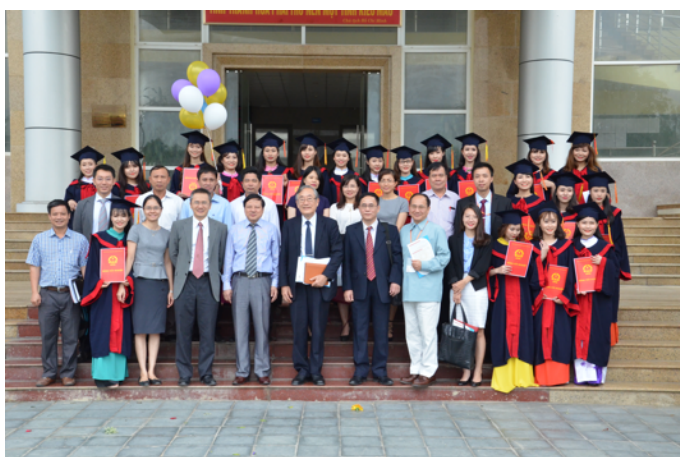
Vinh University での記念撮影