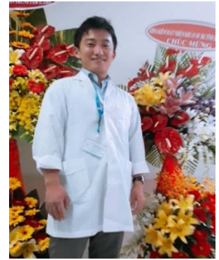
Tại Lễ khánh thành Đơn vị tiếp liệu thanh trùng Khu D (01/2019)