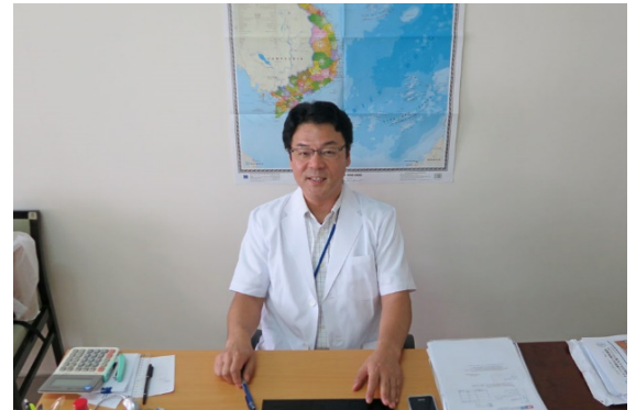
Tại văn phòng dự án

Sau buổi đó, qua hoạt động của dự án, tôi cũng cảm nhận được sự tin tưởng cũng như tình bạn nồng ấm mà các cán bộ của Bệnh viện Chợ Rẫy dành cho người Nhật Bản chúng tôi.