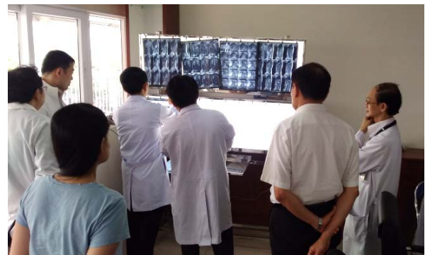
Các thành viên Tumor Board hội chẩn dựa trên các dữ liệu hình ảnh.

Hiện tại, dự án đang hỗ trợ thực hiện Hội chẩn đa chuyên ngành theo mô hình Nhóm chẩn đoán và điều trị bệnh lý ung thư phổi với thành viên nòng cốt gồm các khoa Nội phổi, khoa Ngoại lồng ngực, khoa Giải phẫu bệnh, khoa Hóa xạ trị và Phòng Kế hoạch tổng hợp. Hội chẩn Tumor Board ung thư phổi thực hiện nhằm thảo luận để tìm ra hướng điều trị tốt nhất cho những ca khó trong chẩn đoán, điều trị trên cơ sở cân nhắc ý kiến của từng chuyên khoa. Từ tháng 10/2018 đến nay đã thực hiện được 7 buổi hội chẩn. Lần này, BS. Hashimoto đã tham gia một buổi hội chẩn và có những góp ý về cách thức tổ chức Tumor Board cũng như tư vấn chẩn đoán chính xác hơn.