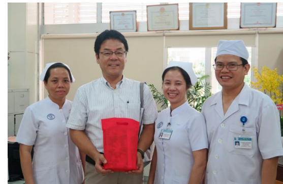
Cùng các cán bộ Phòng điều dưỡng

Tôi cho rằng, chúng ta không bao giờ được quên rằng, sự tin tưởng và tình bạn này có được chính là nhờ thành quả nỗ lực trong suốt 50 năm của rất nhiều bậc tiền bối của cả Bệnh viện Chợ Rẫy lẫn phía đối tác Nhật Bản.