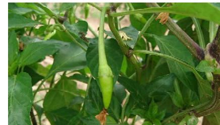
↑ 実も付き始めました。