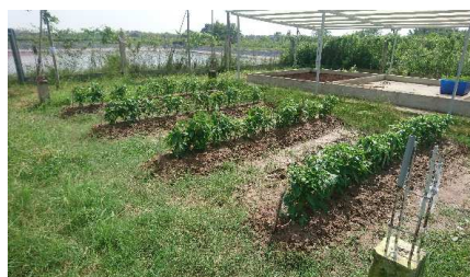
↑ トウガラシの苗も順調に成長中。

9月13日(水)より開始した、発酵槽からの消化液を籾殻に散布し炭化したものを使ったトウガラシ栽培試験ですが、順調に成長を続けており、先日トウガラシの実が付いているのを確認する事が出来ました。12月中旬までの栽培を予定しております。