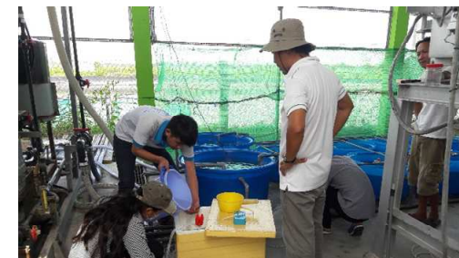
↑ 水槽試験開始準備の様子。