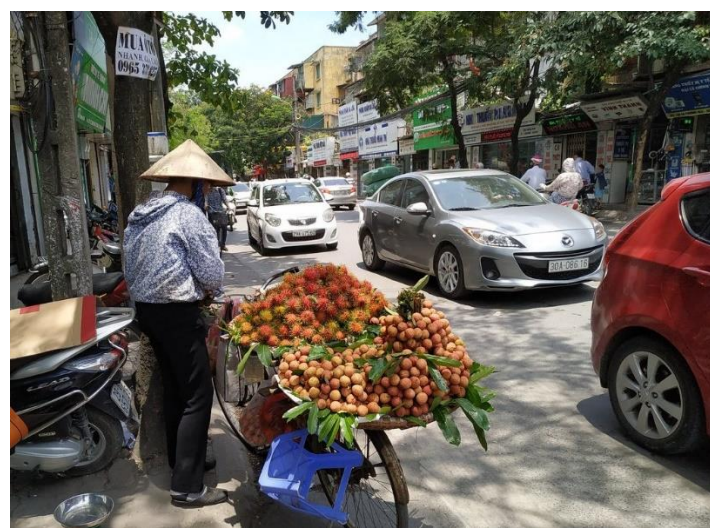
シーズンになるとハanoiでもあちこちでライチが売られています。