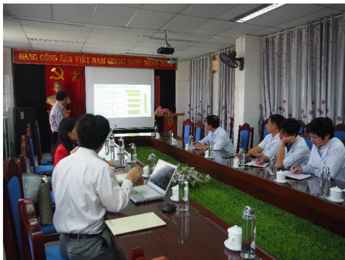
国立熱帯病病院（NHTD）の皆さんと一緒にハイズオン省を訪れ、プロジェクト内容を説明し、参加の意向を確認します