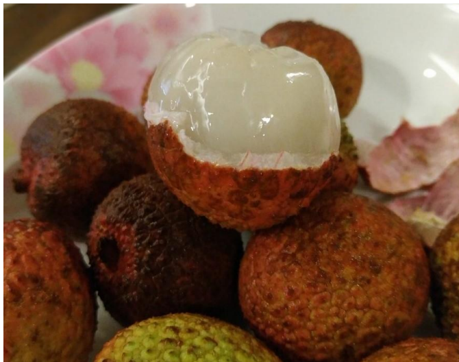
あまーいライチはデザートにピッタリ。2020年からは日本にも輸出され始めました。

また、実はハイズオン省はライチやリュウガンといった果物も有名な土地。今回は季節ではありませんでしたが、ライチシーズンとなる5-6月に訪れた際にはその足でライチ狩りができないかなあ、なんて。