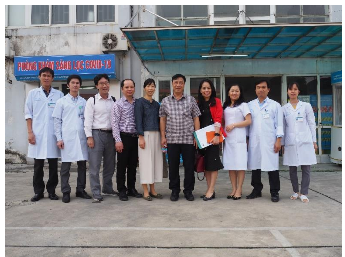
ミーティングを終えて、ハイズオン省熱帯病病院の皆さんと記念写真