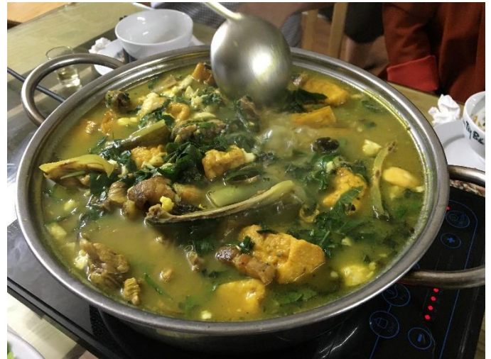
そしてこちらはすっぽん鍋。写真の見た目はイマイチですが、味はなかなかのもの、そして栄養満点

また、実はハイズオン省はライチやリュウガンといった果物も有名な土地。今回は季節ではありませんでしたが、ライチシーズンとなる5-6月に訪れた際にはその足でライチ狩りができないかなあ、なんて。