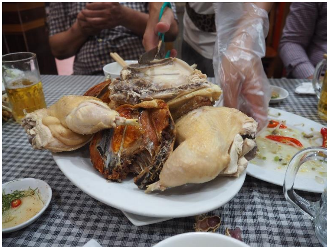
ハイズオン省は鶏肉が有名。揚げてよし、蒸してよし、絶品です♪

そんなハイズオン省では、仕事の合間に地方特産グルメも満喫。すっぽん（唐揚げ、鍋）、鶏肉と色々食べました（笑）。特に鶏肉の美味さは絶品。鶏肉料理屋といえば、「Gà Mạnh Hoạch」という名前は、ハanoiでもあちこちで聞く有名地鶏ブランドですが、調べてみると実はハイズオン省が発祥の地とのこと。道理で鶏肉が美味しいはずですね。