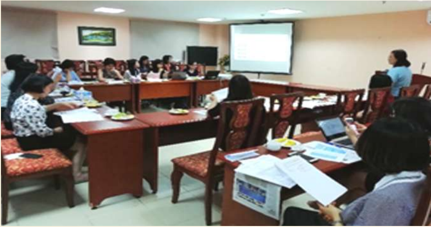
パートナーFSPの選定プロセス について説明するVWU