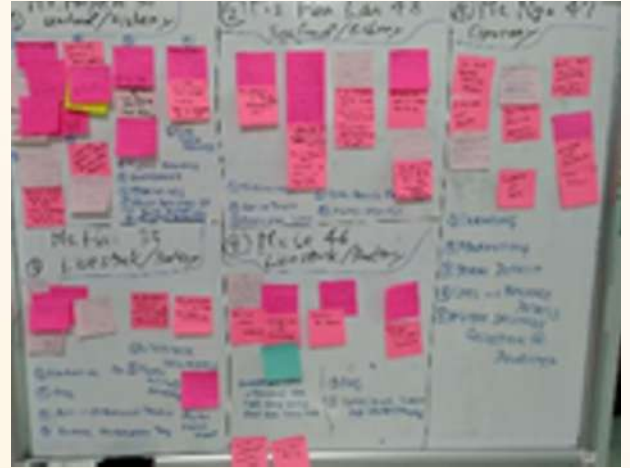
ペルソナに基づいた商品・サービス案のブレスト過程