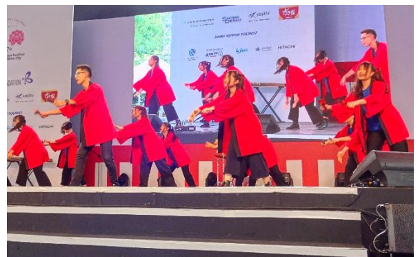
学部生のダンスパフォーマンス