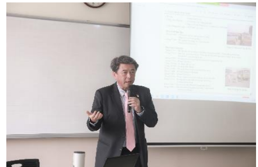
船山会長による講義の様子

学部日本学プログラムでは、「ベトナム国内での日本留学」という方針のもと、多くの専門科目のほか、日本の伝統文化を学ぶ必修科目「Practice of Japanese Traditional Cultures」が開設されており、学生たちは、日本的な美学や、行儀作法の基本を理解することが期待されています。