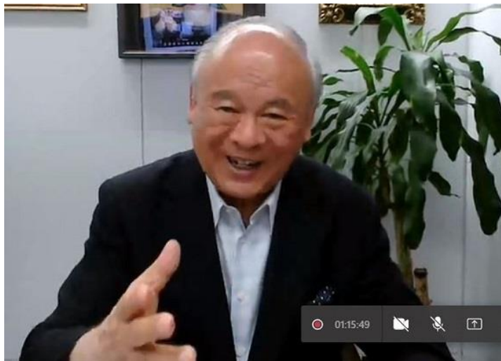
武部勤日越友好議員連盟特別顧問

5月27日、学部日本学プログラムの学生を対象とし、武部勤日越友好議員連盟特別顧問による遠隔講演「地球村時代に生きる気概を」を行いました。新型コロナウイルス感染拡大防止対策により、学生、教職員、日本大使館、JICAなどの関係者、90名がオンラインで参加しました。