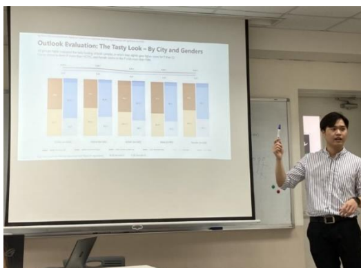
インテージ・ベトナムによる MBA を対象にした特別講座の様子（2021年4月）