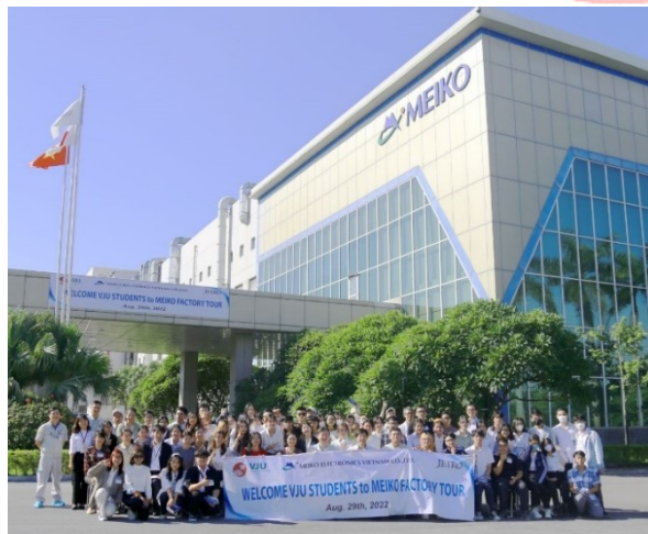
(Meiko Electronics Vietnam Co.,Ltd.へのフィールドトリップの様子)