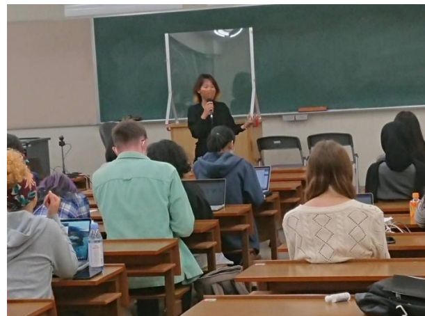
Global Management in Asia での発表