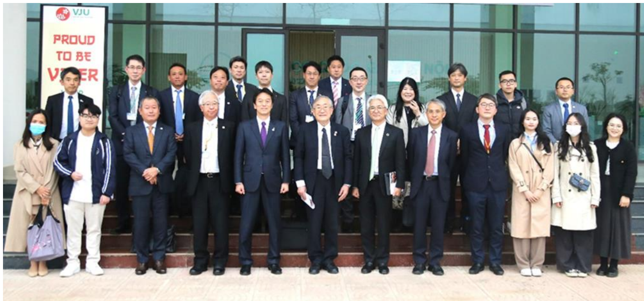
日本メコン地域経済委員会（日本・東京商工会議所）ベトナム経済ミッション参加者（日越大学ホアラックキャンパス）