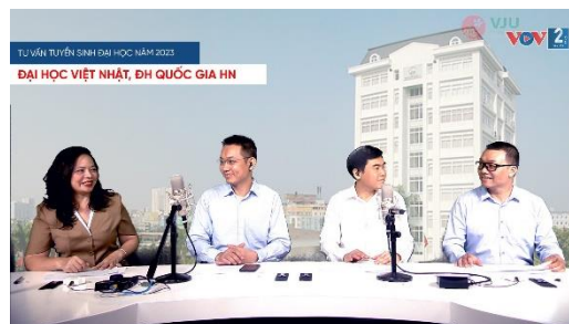
ラジオ番組の収録

https://www.youtube.com/watch?v=zuV7WyeJJQk