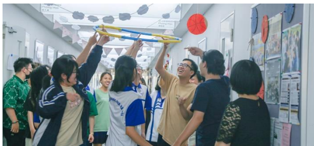
チームワークについてのワークショップ