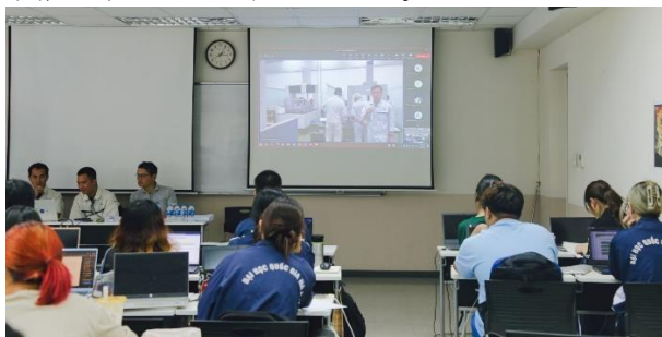
日本とのオンライン中継