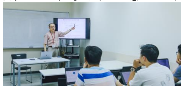
ナノテクノロジープログラムでの講義（2）

これは私の方が感心しているのですが、MNT の面接試験でベトナム人学生に志望動機を聞くと、環境、健康など社会問題を解決するためと答える人がいることです。これは大切なことで、これからの日越大学の方向性を大いに暗示していると思います。私は物質の研究者で、環境問題には直接タッチしていませんが、個人的な願望としては物質開発を通じての環境問題への貢献があります。よく考えてみると、日越大学にはその潜在能力があります。日越大学には気候変動・開発プログラムがあります。日越大学は小規模ですが、それは小回りが利くともいえ、環境のテーマでまとまるにはメリットにもなります。そういう社会的な期待に応えられるような大学にしていくべきではないかと感じています。