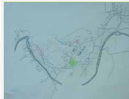
Tầm nhìn về phát triển “Bản làng tốt hơn”