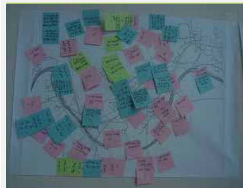
Vẽ bản đồ và phân tích hiện trạng