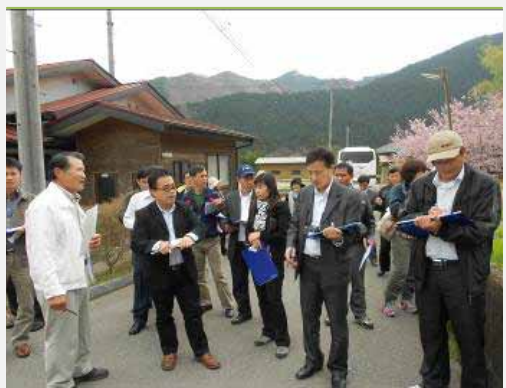
Điều tra xác định các tài nguyên và vấn đề của bản làng

(3) Tầm nhìn về phát triển để “Bản làng tốt hơn” & kế hoạch hành động để cải thiện