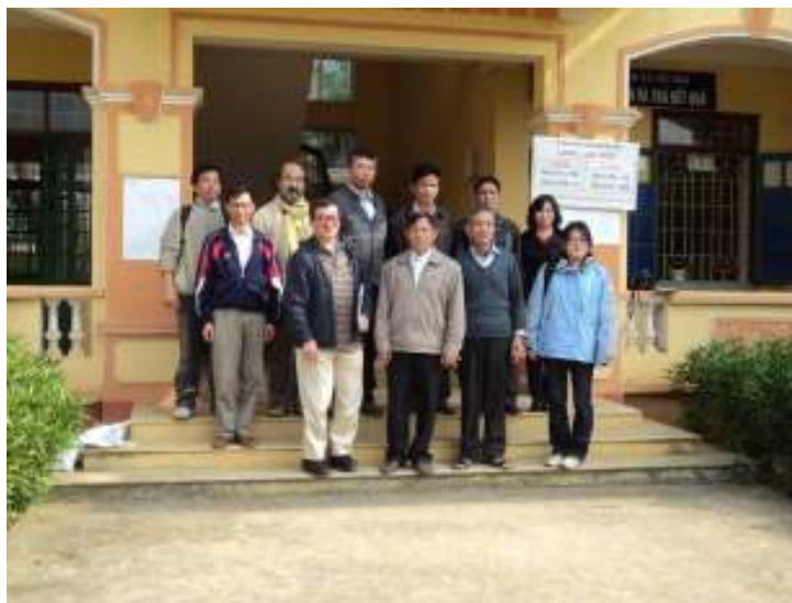
Hình 1. Đoàn tham quan chụp ảnh với đại diện lãnh đạo địa phương tại trụ sở UBND xã Cốc Sơn

Theo kế hoạch từ năm 2006 - 2011 Viện Kinh tế sinh thái với sự tài trợ của Tổ chức Bánh mì cho thế giới (BftW) hỗ trợ thôn Tòng Chú I xây dựng làng sinh thái mở rộng trên vùng đất trống đồi trọc.