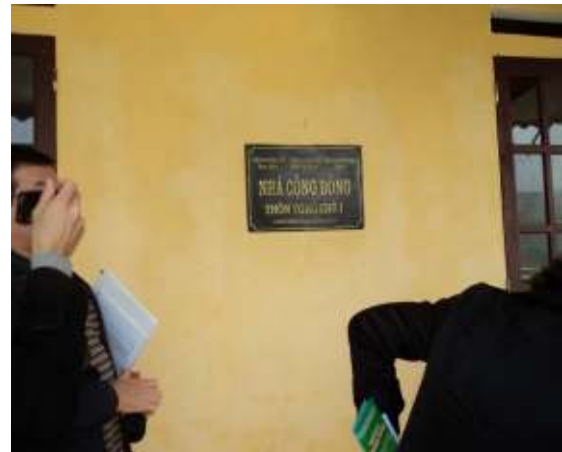
Hình 2. Biển hiệu dự án (bên trái) và nhà công đồng (bên phải)