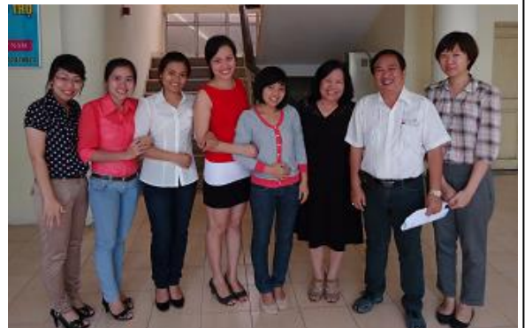
Ảnh trên: Cố vấn trưởng giới thiệu về Dự án Ảnh giữa: Đào tạo tại Tổng đài Ảnh dưới: Giảng viên, học viên và cán bộ Dự án