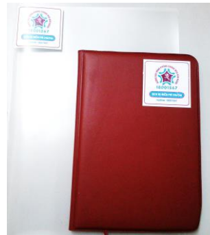
Trên: Sổ và đựng file với logo dự án Giữa: Áo phông có in thông tin dự án Dưới: Tờ rơi

Hoạt động truyền thông tại tỉnh dự án: từ tháng 1-3/2014, Sở LĐTBXH Hà Giang đã tổ chức hội thảo tập huấn tại 5 xã dự án cho 160 giáo viên, trưởng bản và cán bộ địa phương bao gồm công an, biên phòng, phụ nữ, cán bộ phòng LĐTBXH, UBND và Mặt trận tổ quốc.