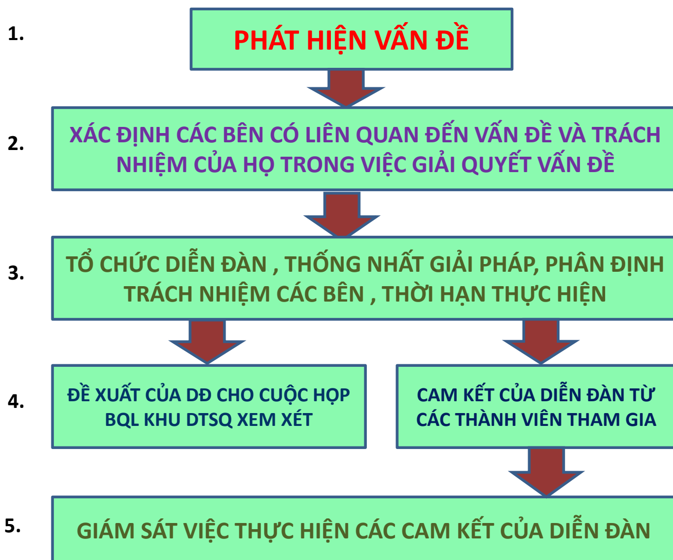
Hình 3: Sơ đồ mô tả sự Vận hành của ĐD QLHT trong khu DTSQ TG Langbiang