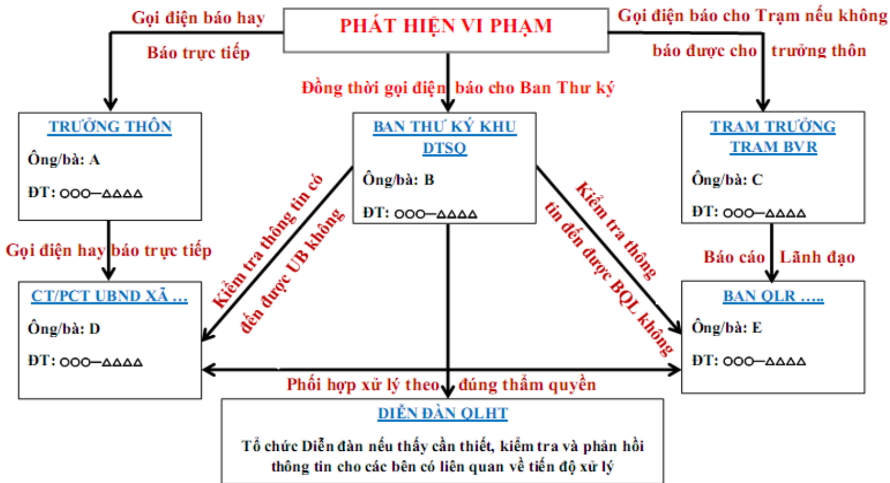
Hình 4: Ví dụ về SOP để thu thập các thông tin về vi phạm lâm luật