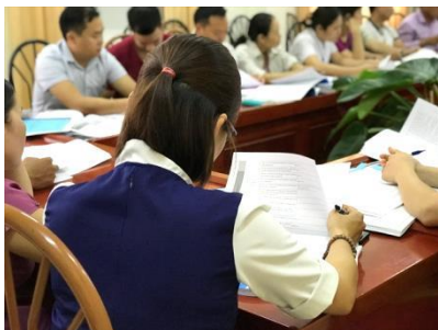
Học viên chăm chú đọc Bảng đánh giá năng lực theo chuẩn năng lực cơ bản của điều dưỡng Việt Nam (tỉnh Điện Biên)