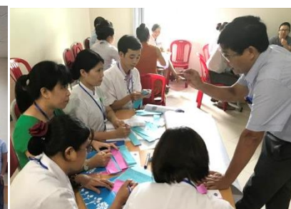
Học viên mô tả hình mẫu người hướng dẫn dựa trên kinh nghiệm mà bản thân đã trải qua (Huế)