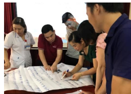
Không khí làm việc nhóm khi xây dựng kế hoạch hỗ trợ điều dưỡng viên mới ( Tỉnh Điện Biên)

Tỉnh Điện Biên (Thời gian thực hiện: 13-17 tháng 5, Đối tượng: 24 người từ 8 bệnh viện trong tỉnh)