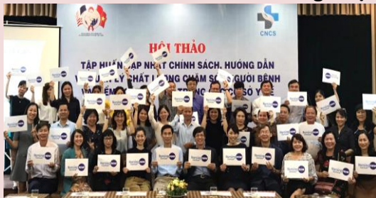
Chiến dịch tầm quốc tế được tổ chức đến cuối năm 2020, Năm Điều dưỡng và Nữ hộ sinh quốc tế. #NursingNow cùng với mọi người của Hội Điều dưỡng Việt Nam!

Mặc dù được công nhận rộng rãi là "Ngày điều dưỡng quốc tế" ở nhiều nước trên thế giới, nhưng tại Việt Nam trước và sau "Ngày điều dưỡng Việt Nam" (ngày 26 tháng 10) nhiều sự kiện được tổ chức tại các bệnh viện. Hội Điều dưỡng Việt Nam tổ chức một cuộc họp thường niên vào thời điểm này trong năm và năm nay đã thu thập ý kiến về việc sửa đổi "Phương pháp chẩn đoán điều trị" quy định giấy phép hành nghề của điều dưỡng. Dự án được mời tham dự sự kiện để giải thích về hệ thống đào tạo lâm sàng và giới thiệu chiến dịch NursingNow mang tầm quốc tế nhằm tăng cường hiểu biết về điều dưỡng và nâng cao vị thế của điều dưỡng.