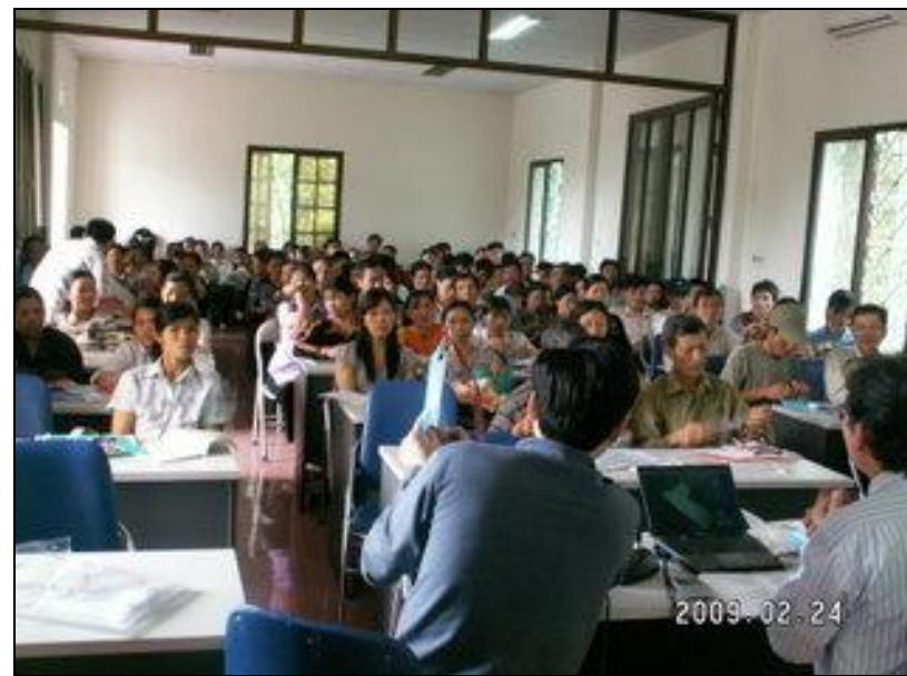
Hội thảo tại Ba Vì